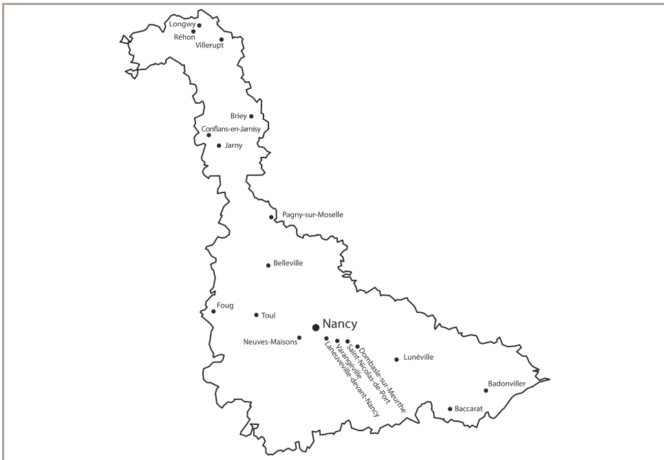
Carte 1 - Les implantations des cours professionnels obligatoires en Meurthe-et-Moselle (1920-1940)

Une question importante est celle de l'adéquation des cours au tissu industriel. On s'attendrait à ce que ces structures soient implantées dans les bassins d'emplois les plus prospères. Or, la situation est fort différente dans les deux départements.