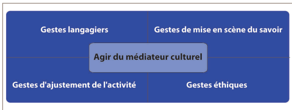
Figure 3 — Matrice de l'agir du médiateur culturel

L'analyse du langage du médiateur donne à voir et à entendre une façon de s'y prendre avec son auditoire : le choix du vocabulaire utilisé, de vulgarisation ou scientifique, le ton de sa voix, la modalité discursive qu'il adopte, l'organisation de son propos comprenant des temps de narration, d'explicitation ou de questionnement adressé au public. Avant de commencer la démonstration du pendule de Foucault, le discours du médiateur se présente comme un récit circonstancié permettant de relater le contexte historique et scientifique ayant permis à Foucault de construire son pendule, les faits, les hommes qui ont compté, la façon dont a été réalisé le pendule et le lieu où il a été exposé. Le récit développé par le médiateur est élégant, utilisant parfois le passé simple. Il donne beaucoup de détails très précis, ce qui prouve sa maîtrise du sujet et son intention de capter l'attention du public dont il vient de faire connais-