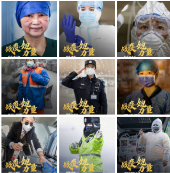
Portraits de femmes mobilisées ( https://ln.qq.com/a/20200316/040317.htm )

Les personnels de santé, désignés par l'expression « les anges habillés de blanc » (白衣天使), déjà abondamment utilisée lors de la crise du Sras en 2003, sont sur la première ligne dans la lutte contre l'épidémie. En 2018, Wuhan est médicalement bien équipée (9 lits d'hôpital pour 1 000 habitants) ; elle compte 110 000 professionnels de santé, dont 40 000 médecins praticiens et 54 434 infirmiers. À la fin janvier, des renforts sont néanmoins envoyés de tout le pays (voir la carte ci-dessous) ; 42 000 nouveaux soignants arrivent dans la province du Hubei, dont 35 000 dans la seule ville de Wuhan. Ils demeurent sur place entre 18 et 50 jours. C'est sur la base du volontariat que les soignants sont mobilisés, et l'offre est tellement nombreuse que certains membres du Parti regrettent de ne pas être sélectionnés 7 . Dans la province du Fujian, une infirmière décrit les difficultés rencontrées ; « Je suis membre du Parti, laissez-moi m'y rendre ! » s'exclame-t-elle 8 . De nombreux soignants non encore membres soumettent des demandes d'adhésion avant de partir au Hubei, utilisant l'expression « joindre le Parti sur la ligne de feu » (火线入党). La province du Guangxi envoie ainsi 962 soignants au Hubei, dont 884 membres du Parti, parmi lesquels 474 sont de nouveaux membres 9 . Le Parti communiste se saisit donc de la crise sanitaire comme une opportunité pour grossir ses rangs.