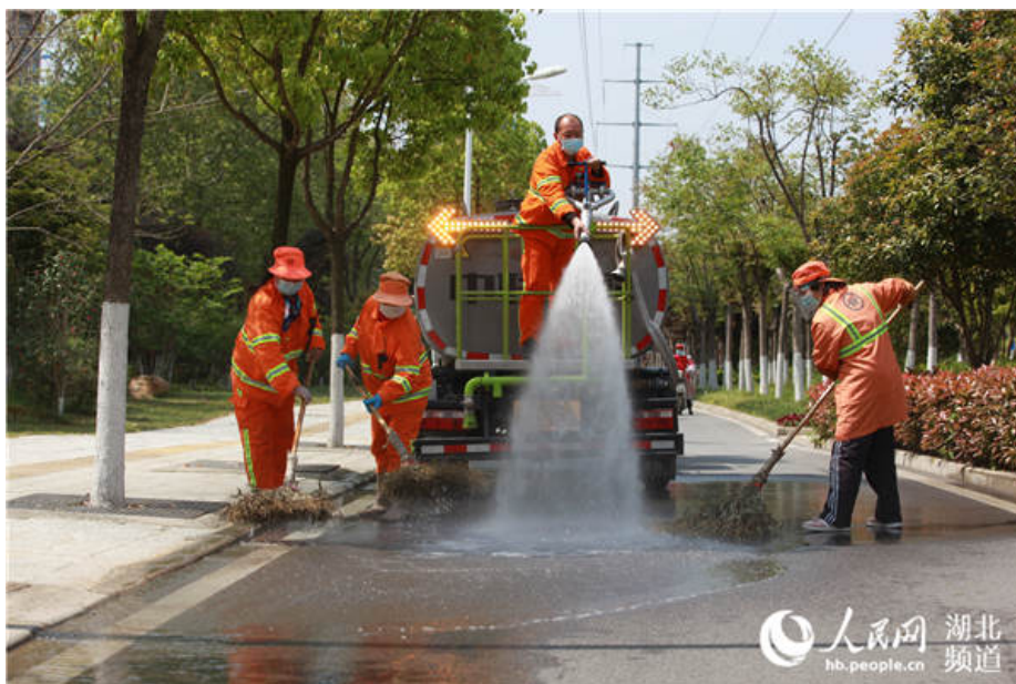
Une équipe de nettoyage à l'œuvre à Wuhan

Le travail d'assainissement consiste en balayage, lavage à grande eau et désinfection des routes principales et secondaires, des ruelles, des impasses, du mobilier urbain, des bus, des plateformes de métro, des toilettes publiques... La fréquence journalière de ramassage des ordures est accrue et une attention particulière est portée aux points de collecte des masques usagés, ainsi qu'aux poubelles des hôtels de mise en quarantaine. Afin de rendre compte de l'efficacité et de l'étendue des opérations, un grand nombre de données chiffrées sont communiquées par la presse : outre celles touchant aux effectifs supplémentaires, les chiffres abondent sur le tonnage des ordures ramassées, la longueur des rues nettoyées, les surfaces désinfectées, le nombre d'impasses, de poubelles vidées, de toilettes publiques désinfectées etc.