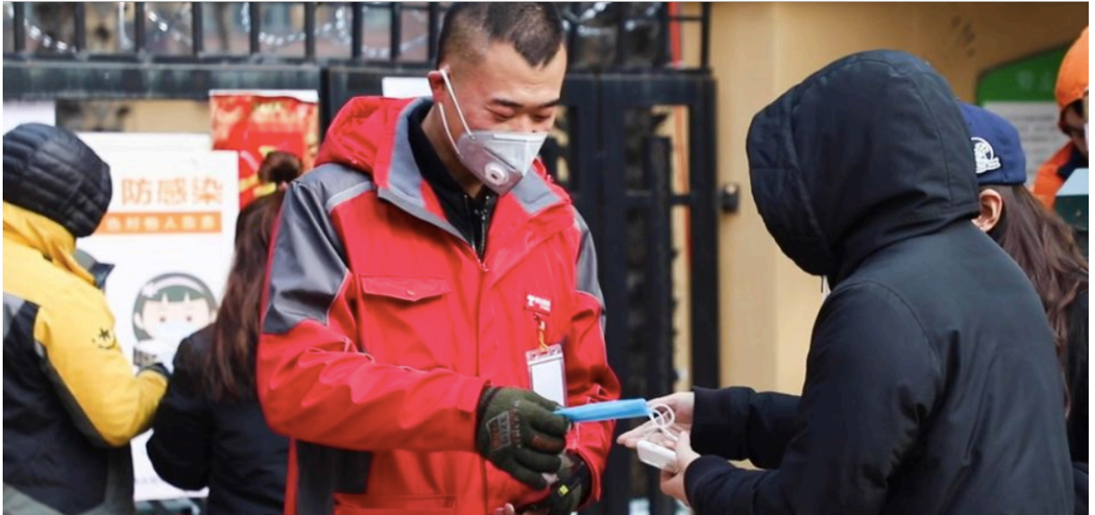
Livreur à la porte d'une résidence 42

Pour tous, se pose la question de l'intensification du travail. Si les employés de remplacement pour le culte des ancêtres sont rendus visibles par les nombreuses photos publiées, les heures supplémentaires qu'ils effectuent et les souffrances psychologiques qu'ils endurent sont peu mentionnées. En une seule journée, à Canton, l'un d'eux s'incline plus de 500 fois devant des tombes 43 ; à Ha'erbin, deux employés en binôme essuient les stèles et effectuent les rites devant 10 à 20 tombes par jour 44 ; ailleurs, une employée, en charge de la communication avec les parents des défunts, travaille jusqu'à 23 h le soir et a parfois reçu des appels à 2 h du matin 45 . Les longues journées de travail sont également le lot des livreurs et des personnels du nettoyage.