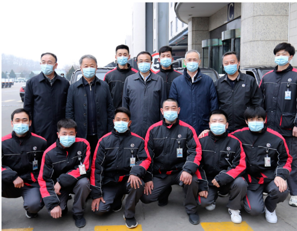
Li Keqiang visitant un centre de logistique à Pékin le 6 mars 2020 33

Un autre secteur ayant massivement recruté est la grande distribution. Hema, Suning, Carrefour ou Walmart, confrontés à une intensification de leur activité de commandes à distance, ont proposé des contrats temporaires. Parfois, les géants de la distribution ont négocié avec d'autres sociétés à l'arrêt, dans l'hôtellerie ou la restauration, des prêts de personnels, appelés en chinois « partage des talents » (人才共享), ou « partage des personnels » (共享员工) 34 , une pratique peu diffusée jusqu'alors et qui a des équivalents notamment en France 35 . Ainsi à Pékin, Hema accueille dans ces rangs les personnels de plusieurs chaînes de restaurants. Plusieurs dizaines de milliers de salariés sont concernés. L'échange de personnel ne se limite pas au seul secteur de la distribution ; on a trouvé mention d'entreprises de nettoyage y ayant recours, ou d'une usine Haier de réfrigérateurs à Hefei dans l'Anhui. Dans cette ville, l'administration locale a activement encouragé le processus ; le bureau des Affaires humaines et sociales de la ville, par médias interposés, a incité les employés de la restauration à occuper 6 000 emplois temporaires dans 21 entreprises industrielles 36 . Les salaires sont soit payés par l'entreprise d'origine dans le cadre d'un accord entre les deux employeurs, soit directement par le nouvel employeur après signature d'un contrat temporaire 37 .