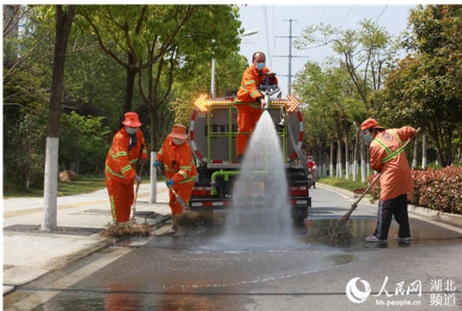
Une équipe de nettoyage à l'œuvre à Wuhan

Le travail d'assainissement consiste en balayage, lavage à grande eau et désinfection des routes principales et secondaires, des ruelles, des impasses, du mobilier urbain, des bus, des plateformes de métro, des toilettes publiques... La fréquence journalière de ramassage des ordures est accrue et une attention particulière est portée aux points de collecte des masques usagés, ainsi qu'aux poubelles des hôtels de mise en quarantaine. Afin de rendre compte de l'efficacité et de l'étendue des opérations, un grand nombre de données chiffrées sont communiquées par la presse : outre celles touchant aux effectifs supplémentaires, les chiffres abondent sur le tonnage des ordures ramassées, la longueur des rues nettoyées, les surfaces désinfectées, le nombre d'impasses, de poubelles vidées, de toilettes publiques désinfectées etc.