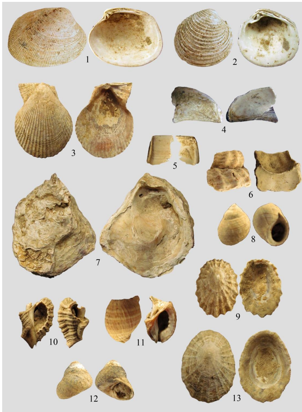
Fig. 2 – Espèces détectées dans la vignette 2 F13 de Loscolo à Pénestin, 1- Palourde Ruditapes decussatus (35mm), 2- Prairie Venus verrucosa (28mm), 3- Pétoncle Mimachlamys varia (41mm), 4- Moule Mytilus edulis (31mm), 5- Couteau Solen sp. (14mm), 6- Buccin Buccinum undatum (18mm), 7- Huître plate Ostrea edulis (58mm), 8- Bigorneau Littorina littorea (17mm), 9- Patelle Patella depressa (26mm), 10- Murex Ocenebra erinaceus (13mm), 11- Pourpre Nucella lapillus (17mm), 12- Monodonte Phorcus lineatus , 13- Patelle Patella vulgata (43mm, DAO C. Dupont).

Même si l'extraction de colorant à partir des coquillages est connue le long du littoral plusieurs éléments peuvent motiver une fouille plus approfondie du site en question. A ce jour, la plupart des sites repérés et présentant cette activité sont connus par prospection et ne sont pas calés chronologiquement. Hors cette activité semble attestée de l'âge du Bronze au Moyen Age (14 e s.). De plus, une telle activité a été repérée sur la commune de Pénestin à la plage du Lomer (Jacquet 2003, Gauthier 2006, Daire et al. 2015, Dupont et al. 2018). Sa présence au bord de la falaise et en zone protégée rend une intervention archéologique