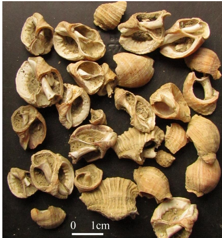
Fig. 3 – Pourpes et murex cassés latéralement issus de la vignette 2 F13 (Loscolo, Pénestin, DAO C. Dupont).

complexe, ce qui fait que malgré le suivi régulier de ce site depuis plusieurs dizaines d'années, son calage chronologique n'a pas pu être défini. Les premiers indices du diagnostic archéologique tendraient à placer l'activité de la fin de l'âge du Fer au début de l'antiquité. Ce calage pourrait être confirmé voire affiné en cas de fouille. L'analyse malacofaunique envisagée permettra de décrire le processus l'extraction des glandes tinctoriales mais aussi, par l'analyse de la taille originelles des coquilles, de la gestion du stock naturel de pourpres sur les proches estrans.