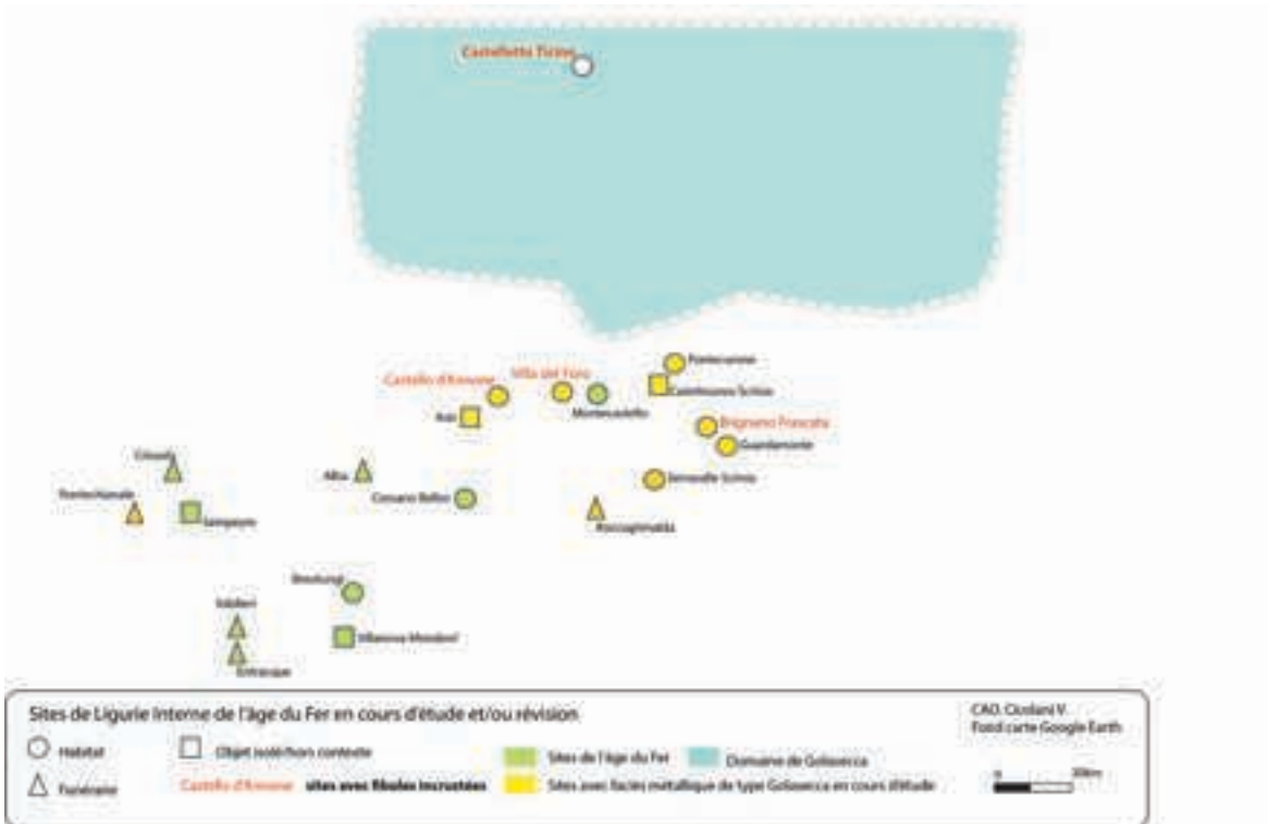
Fig.1 - Carte de distribution du mobilier au nord (points bleus) et au sud (points rouges) des Alpes. Élaborée par V. Cicolani, fond de carte Geocarta.