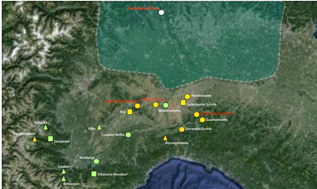
Sites de Ligurie Interne de l'âge du Fer en cours d'étude et/ou révision

des exemples les plus flagrants. La caractérisation de ces phénomènes, tout comme la définition précise des traits culturels propres à chaque communauté italique, bénéficie d'une longue tradition d'études,