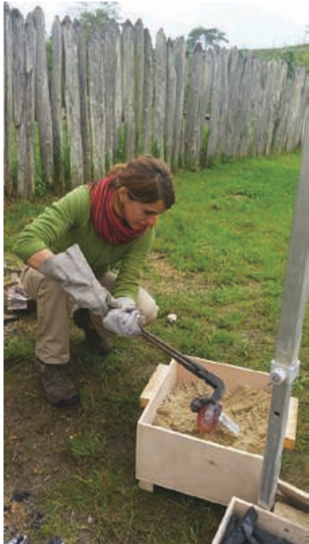
Fig. 5 - Coulée d'une fibule au parc archéologique de Samara, en collaboration avec l'association Calcophore. V. Cicolani AORoc CNRS ENS-PSL, Paris

fibule et la jonction entre le corps de la fibule et le porte-ardillon. Ces faiblesses structurelles ont parfois été résolues en réparant l'objet par rivetage ou par réinsertion puis fixation des éléments par surcoulée, permettant ainsi de prolonger l'usage de ces objets du quotidien.