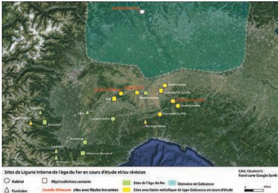
Fig. 4 - Carte de répartition des sites en cours d'étude. D'après Cicolani - Berruto 2017.