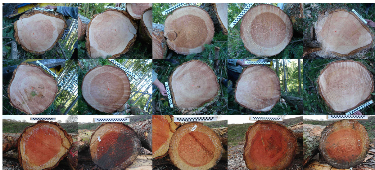
Fig. 1 : Images issues des jeux de données. Deux premières lignes issues de Besle et la dernière issue de BBF .

Chaque grume a été prise plusieurs fois (de 3 à 5 fois) en tournant légèrement à gauche ou à droite la caméra entre chaque vue. Nous considérons que la position de la moelle est représentée par un pixel, bien que d'un point de vue biologique elle peut occuper une plus grande surface. Les vérités terrains, c'est-à-dire la position réelle de la moelle sur chaque image, ont été évaluées manuellement par deux opérateurs différents.