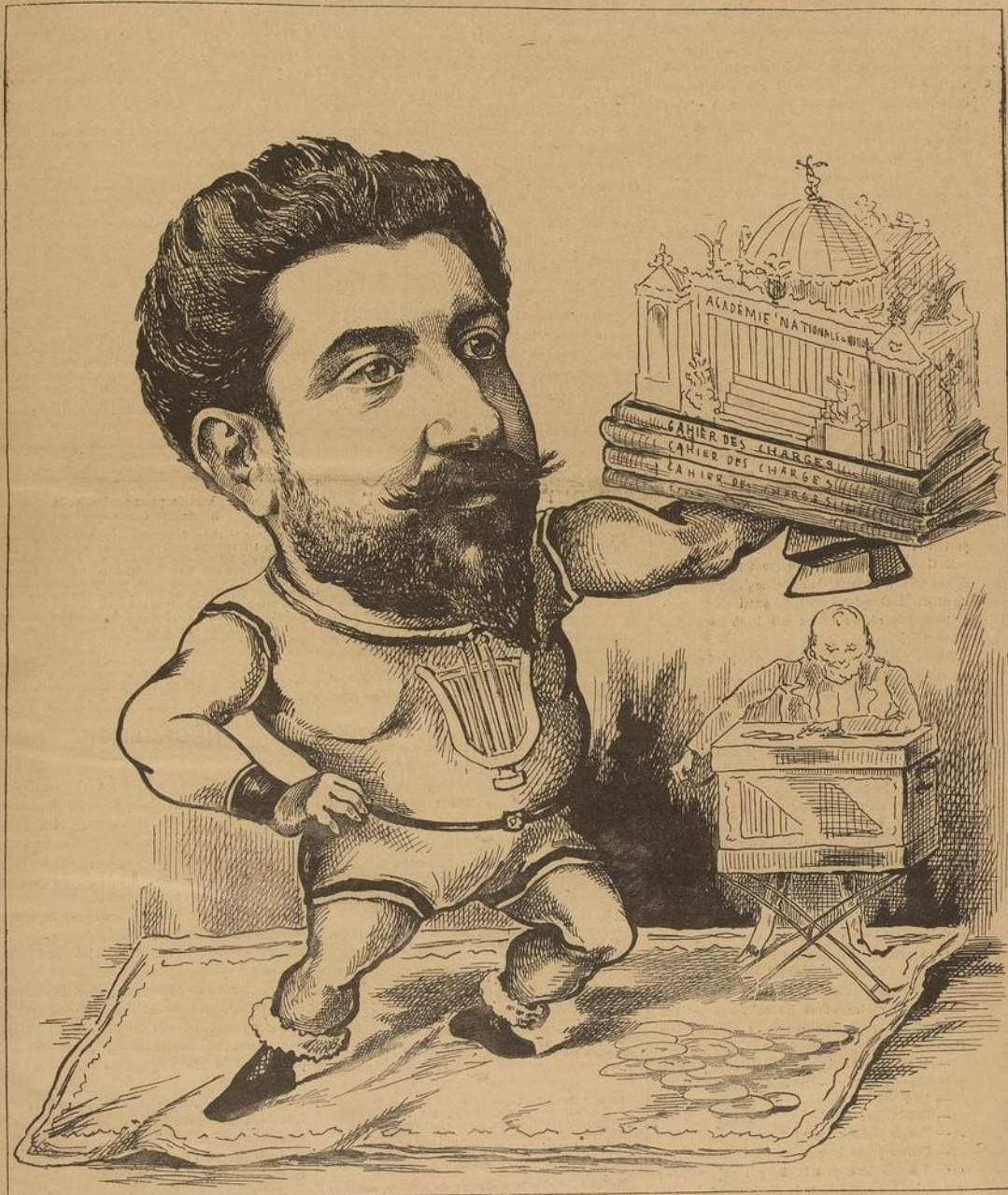
Un solide Gailhard.