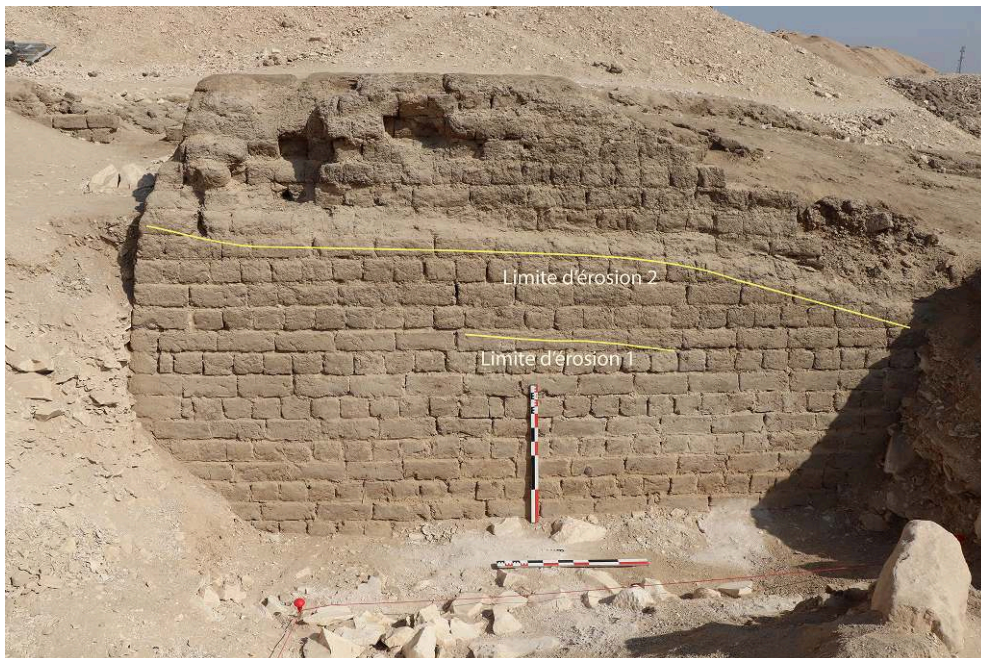
Fig. 4. Fondations du pylône de la TT 33, opération A, vue vers l'est.