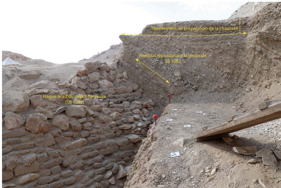
Fig. 9. Hague 1082 et coupe dans le remblai de terrassement de la chaussée de Thoutmosis III, vue vers l'ouest, opération A.