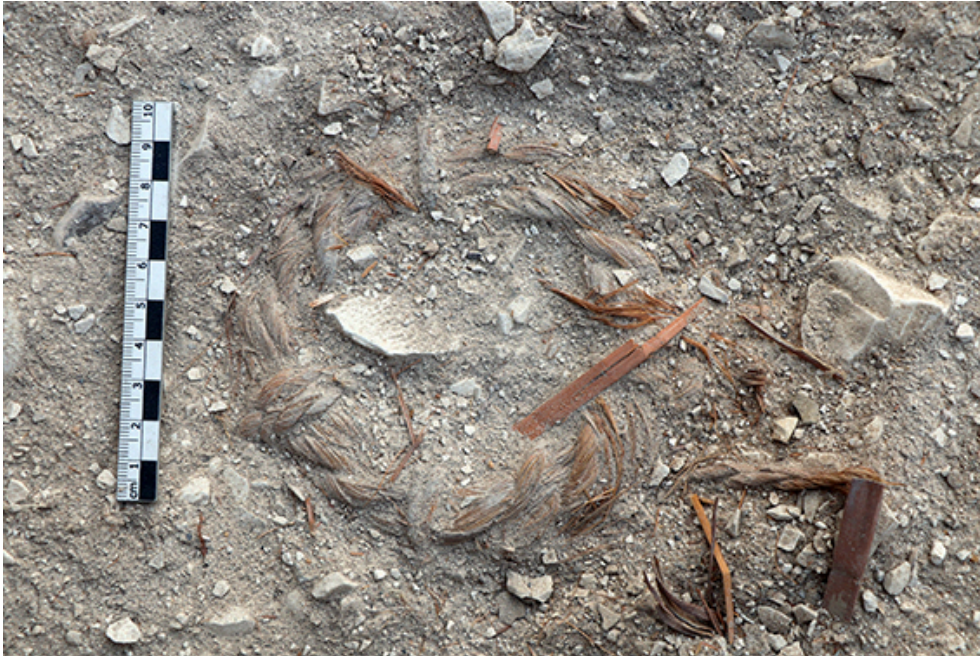
Fig. 3. Support de vase céphalique in situ , dépôt de sol (opération A, US 1193).