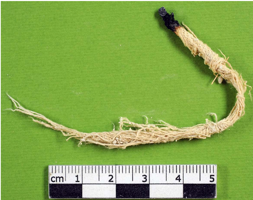
Fig. 6. Mèche 1213-4 provenant de la 1 ère phase de remblai de la tranchée du pylône, opération A (G. Clapuyt).