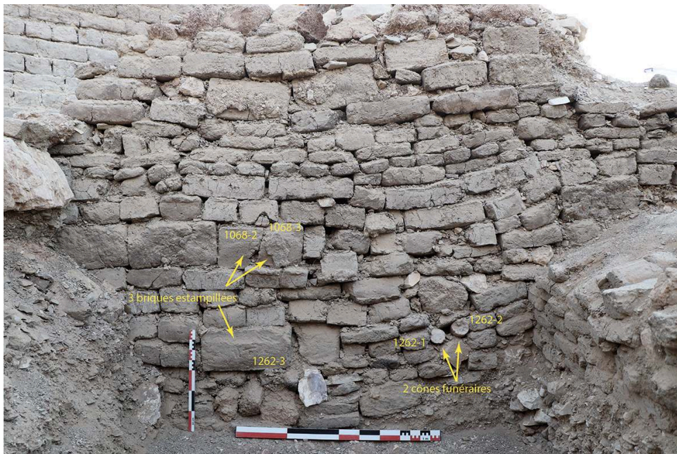
Fig. 10. Briques estampillées et cônes funéraires employés dans la hague 1262 = 1068, opération A (F. Colin).