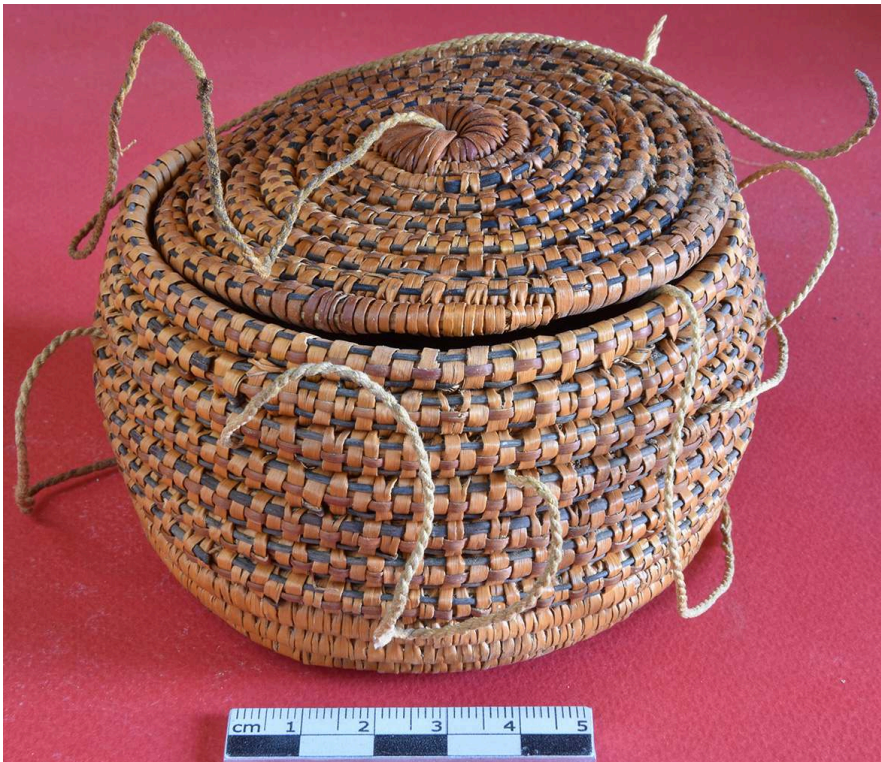
Fig. 13. Panier en vannerie 1245-A+B (F. Colin).