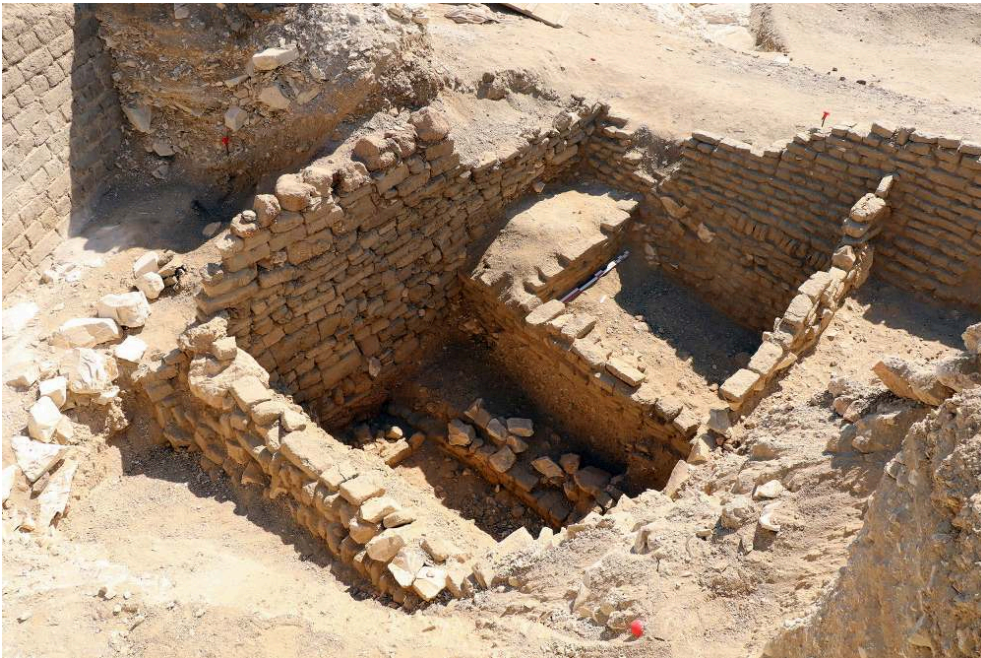
Fig. 8. Terrassement cellulaire et fondations du pylône de la TT 33, opération A en fin de fouille (F. Colin).