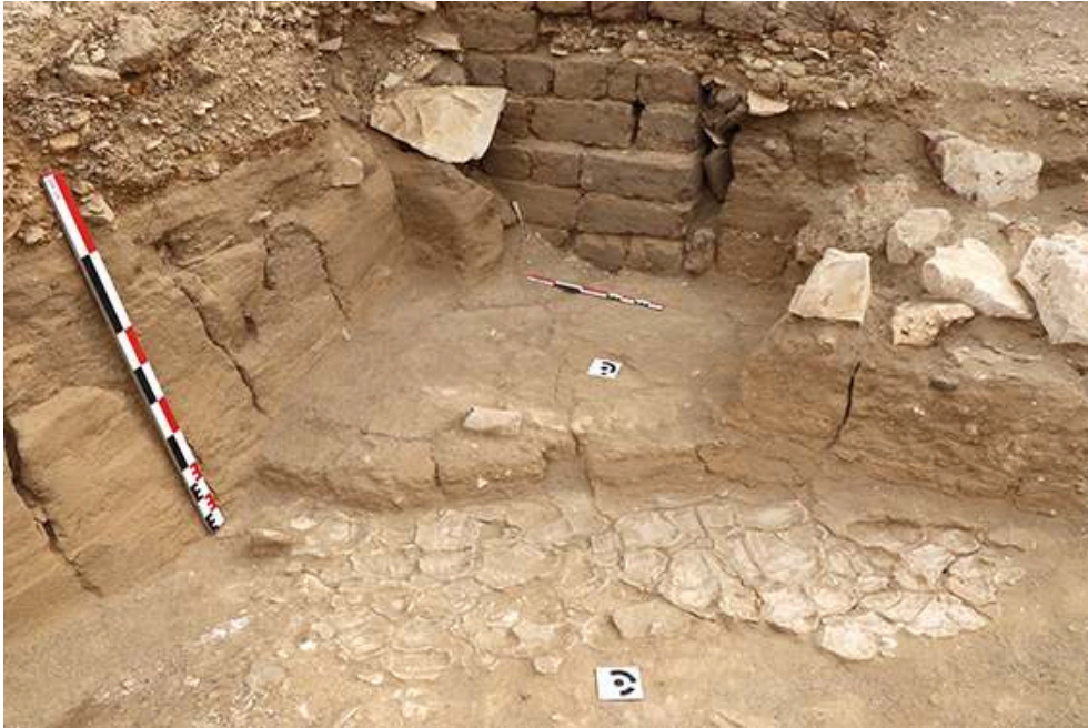
Fig. 11. Différents niveaux de boue séchée dans le dépôt alluvial en avant du pylône. Cône funéraire 1118-1 in situ , opération B. (F. Colin).

crues éclairs dans la région (divers épisodes alluviaux d'époque historique dans la montagne thébaine, stèle de la tempête).