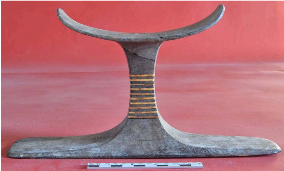
Fig. 12. Appuie-tête 1246-A+B (F. Colin).

côté droit, la défunte assise sur un siège funéraire reçoit des offrandes de dix personnages tous féminins, à l'exception d'un jeune garçon accompagnant une des dames. Certains des objets offerts représentés en deux dimensions (un miroir, un pot à kohl) ont par ailleurs été découverts sous leur forme d'artefact à l'intérieur de la cuve 12 . Du côté gauche, le décor présente le transport de la momie de Ta-Abou sur une barque, entourée d'une série de sept pleureuses. Cette combinaison thématique peut être comparée à plusieurs parallèles. Dans la tombe C 37 (El-Birabi), Carter et Carnarvon mirent au jour, dans un assemblage scellé sous Thoutmosis I er , le sarcophage à fond blanc d'un certain Montouhotep comprenant, d'un côté de la cuve, une scène d'offrande à la momie entourée de pleureuses et, de l'autre, le transport de la momie tractée par des bovinés 13 . Quant au cercueil de dame Metcha découvert par Bernard Bruyère au cimetière de l'est, à Deir el-Médina, il présente d'un côté une scène de traction de la momie et, de l'autre, une offrande funéraire à la défunte siégeant auprès de son compagnon – en l'occurrence, des scarabées aux noms d'Hatchepsout et de Thoutmosis III se trouvaient dans la cuve 14 .