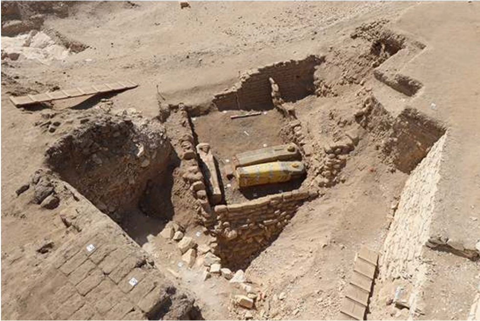
Fig. 7. Assemblage des sarcophages 1244, 1245 et 1246 in situ , terrassement cellulaire et fondations du pylône de la TT 33, opération A (F. Colin).