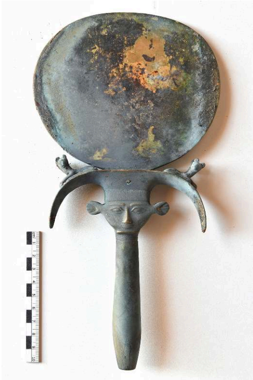
Fig. 14. Miroir en bronze 1244-P (F. Colin).