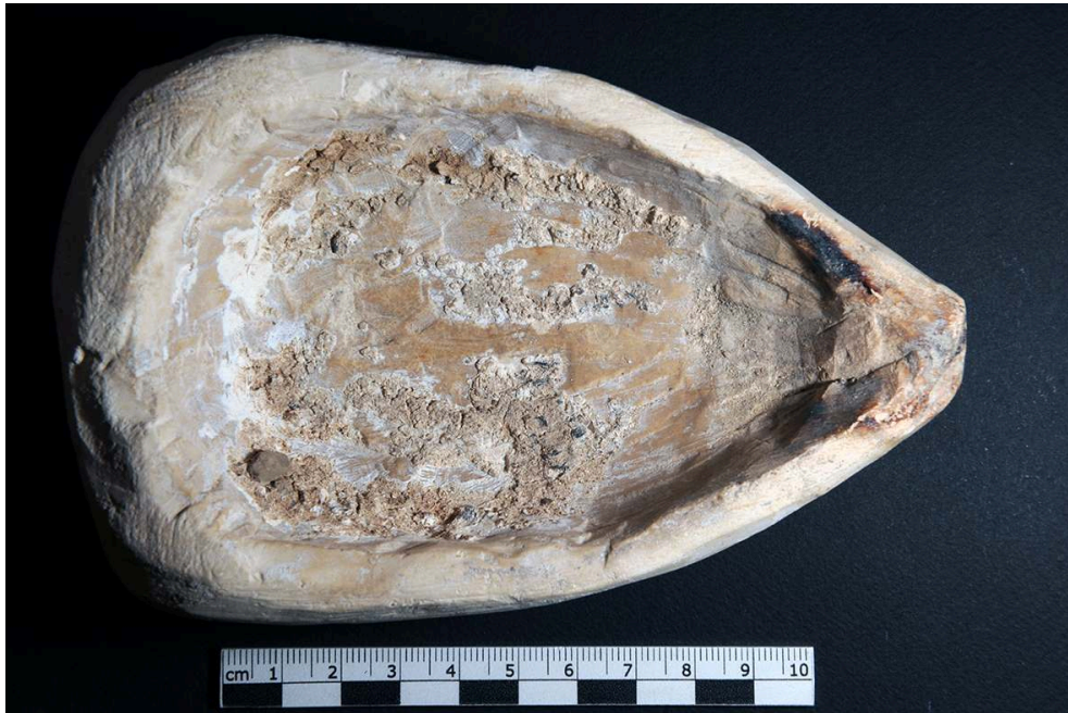
Fig. 5. Lampe à huile 1137-1 provenant des déblais de la XXVI e dynastie, opération A (H. Smets).