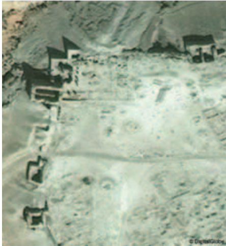
Fig. 9 : Secteur du grand temple de Bêl dans l'angle nord-ouest de la ville, et de la tour 24 des remparts ; le nord est en haut. Les abords immédiats du temple sont relativement préservés au regard du reste du site, les colonnes et murs restaurés de 2002 à 2004 sont toujours en place. Les fortifications en pierre semblent relativement en bon état, la partie en briques crues peut-être abîmée. (source UNOSAT UNITAR, image © DigitalGlobe).