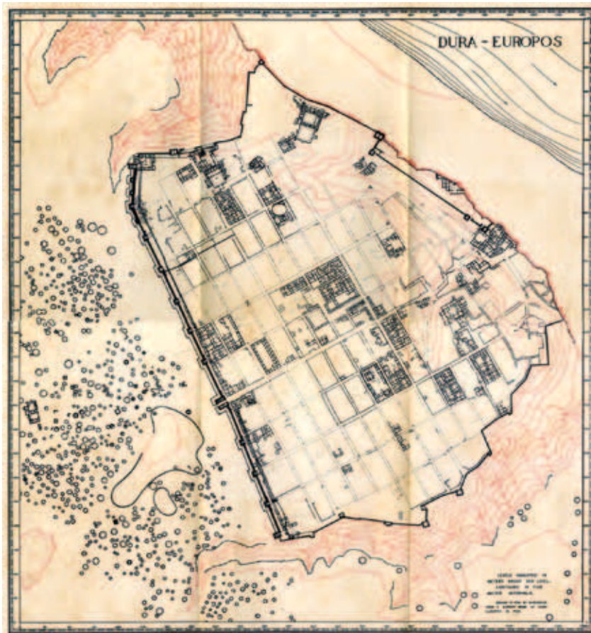
Fig. 1 : Plan de Doura-Europos, à l'extérieur, les sépultures fouillées sont représentées par des cercles.