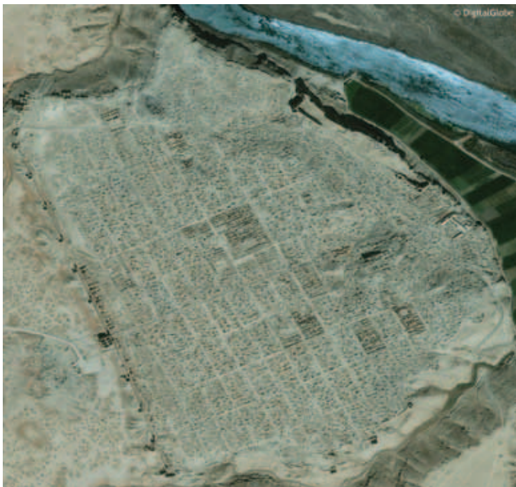
Fig. 6 : Vue rapprochée de l'image satellite précédente du 11 avril 2015. Le nord est en haut.

Aujourd'hui, il est possible que les pillards aient porté à Doura-Europos un coup qui pourrait lui être fatal (Fig. 5 et 6). Récemment, le site a connu une nouvelle forme de violence : le vol systématique de son sous-sol pour en arracher des trésors archéologiques. Des images prises sur place nous ont permis de constater que, dès 2012, la maison de fouilles destinée à héberger les missions archéologiques a été vandalisée et vidée, et que le musée de site, inauguré en 2005, a également été vidé, ses portes arrachées, ses vitrines cassées. En 2013, des pillages ont été opérés de manière systématique sur l'ensemble du site, qui a alors vu sa surface transformée en une série de cratères juxtaposés, correspondant