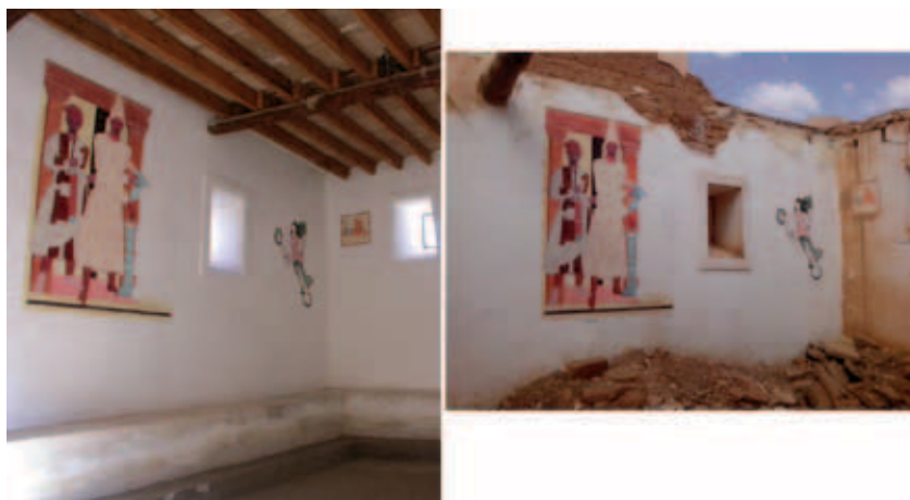
Fig. 8 : Pièce d'accueil du musée de site. À gauche en avril 2005, (source H. David-Cuny. À droite en avril 2013, © transféré à M. Gelin).

Les bâtiments anciennement fouillés par les missions régulières semblent avoir moins souffert que les zones non fouillées au préalable : leurs cours ont presque toutes subi des excavations, et des pièces ont également été pillées mais, de manière générale, les dégâts paraissent moindres que sur les autres zones. Leurs élévations sont relativement préservées. Les fortifications dans leur ensemble sont apparemment toujours en place, ainsi que les zones à proximité immédiate, à l'exception des abords de la citadelle. Parmi les édifices restaurés, le palais du stratège, la maison chrétienne et le temple de Bêl ont conservé leurs élévations, y compris les colonnes ; près du temple de Bêl, une zone semble relativement épargnée, en comparaison avec le reste du site (Fig. 9). L'image ne permet pas de se