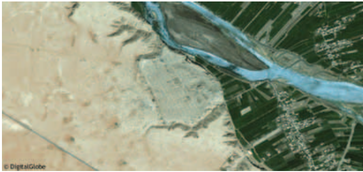
Fig. 5 : Vue satellite de Doura-Europos le 11 avril 2015. Le nord est en haut.