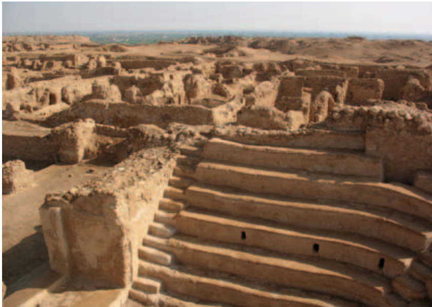
Fig. 4 : Vue de Doura-Europos, 21 mars 2009, vers l'est. Au premier plan, l'odéon du temple d'Artémis ; derrière, le temple d'Atargatis. Au fond, la vallée de l'Euphrate.

De nombreuses demeures furent bâties sur l'ensemble de la surface intra-muros. L'art, foisonnant à cette époque, reflète la nouvelle influence parthe, notamment les bas-reliefs et les peintures murales (Fig. 3). Dans la nécropole, de nombreux hypogées furent creusés dans le sous-sol et des tombeaux-tours visibles depuis les murs de la ville furent élevés, ainsi qu'un temple hors-les-murs, consacré par des Palmyréniens.