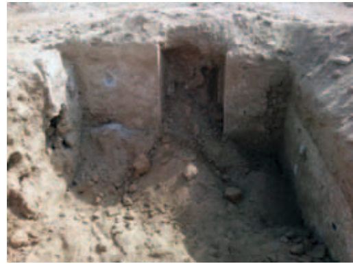
Fig. 7 : Fouille clandestine dans une pièce de Doura-Europos, avril 2013, © transféré à M. Gelin. Les excavations ont détruit toute relation stratigraphique entre les couches archéologiques et les constructions et s'approfondissent sous les murs.