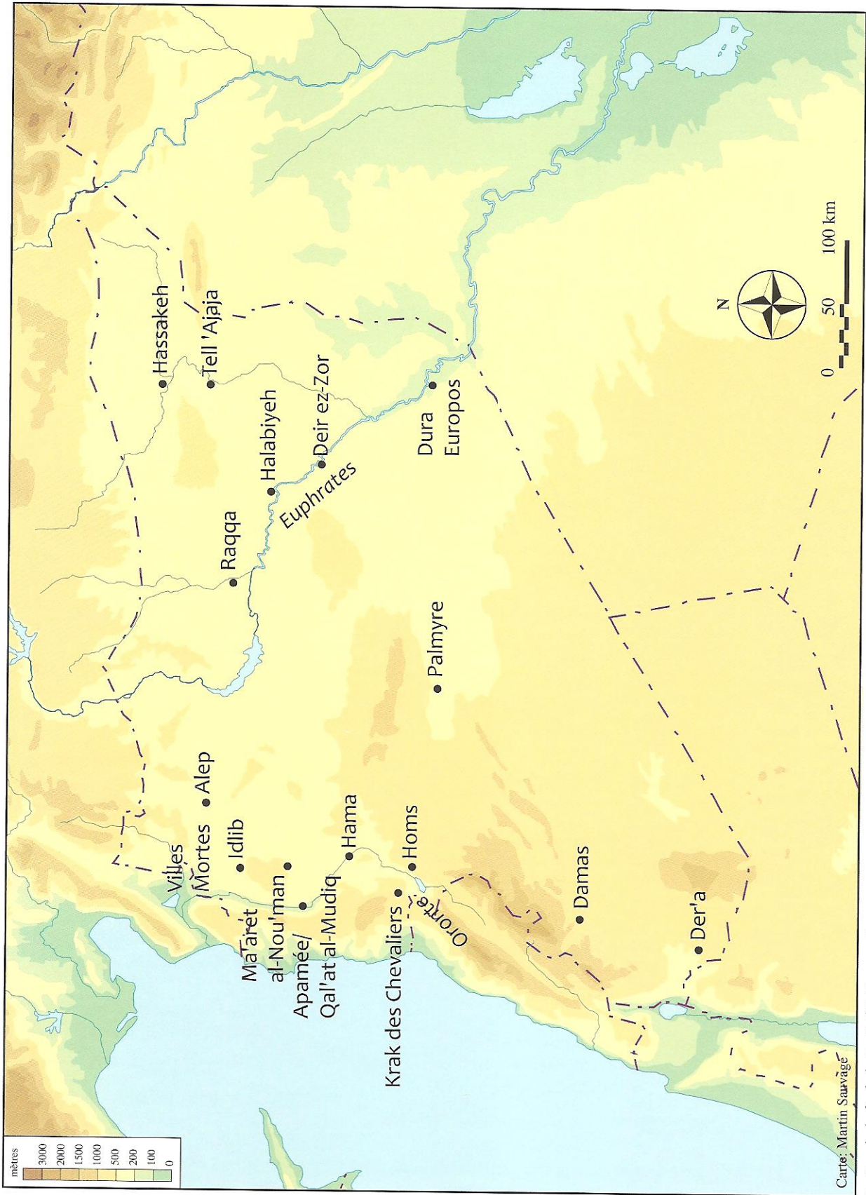
Carte: Martin Sauvâgé