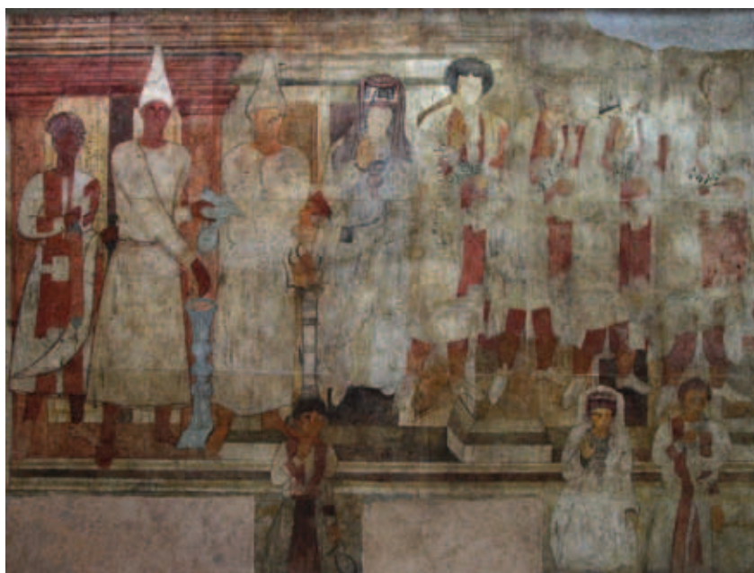
Fig. 3 : Les peintures du temple de Bêl : le sacrifice de Conon au Musée national de Damas, après restauration, 2004.

que Hatra en Haute Mésopotamie. La présence d'une communauté de Palmyréniens est avérée à Doura, vraisemblablement en relation avec des activités commerciales. De nouveaux temples fleurirent, dont certains consacrés à des divinités syro-mésopotamiennes telles Azza-nathkôna, Aphlad ou Bêl 6 (Fig. 2), ou encore le temple des Gaddé consacré aux divinités protectrices de la ville, ou le temple de Zeus Kyrios.