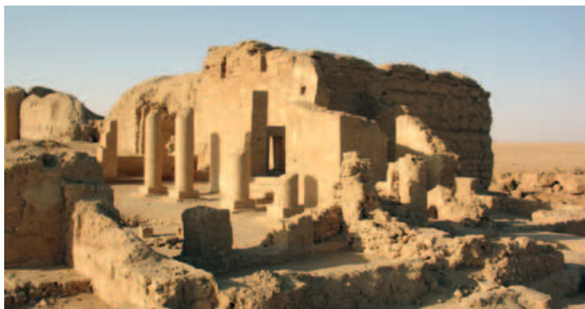
Fig. 2 : Le grand temple de Bêl après restauration partielle, vers le sud-ouest, 10 mars 2009.

À leur tour, les Arsacides engagèrent un vaste programme de construction, qui vit la surface de la nouvelle ville, en grande partie encore vierge de constructions, se couvrir de bâtiments tout en respectant majoritairement le plan urbain initial implanté par les Grecs. Il semble que la cité connut alors une période de relative prospérité et que les défenses ne servirent plus que de point de surveillance, avec une avant-cour pour contrôler les entrées dans la ville. La présence parthe se prolongea près de trois siècles et de nombreux échanges sont attestés avec les cités voisines, dont Palmyre dans la steppe syrienne, les villes installées le long de l'Euphrate, ainsi