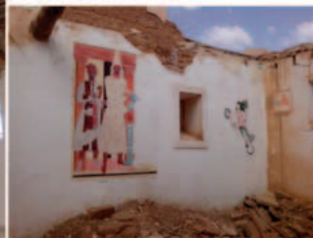
Fig. 8 : Pièce d'accueil du musée de site. À gauche en avril 2005, (source H. David-Cuny. À droite en avril 2013, © transféré à M. Gelin).

faire une idée correcte de l'état de l'odéon du temple d'Artémis, car on n'y aperçoit pas les gradins, mais il est possible que la dernière mission archéologique les ait protégés en les recouvrant de terre.