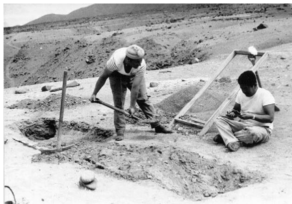
Figura 2. “Excavaciones del conchal ubicado justo sobre la aguada de Cerro Moreno, diciembre de 1964”.

los antiguos conchales, abandonados hacía siglos (figura 2). Ni siquiera la notable aguada de Cerro Moreno, que tuve oportunidad de conocer y examinar en diciembre de 1964 (figura 3), era visitada y concurrida, como antaño, por los pescadores o pequeños pirquineros locales, tal como nos lo describe el capitán chileno Luis Pomar hacia 1885 (2008a, 2019b, 2020a).