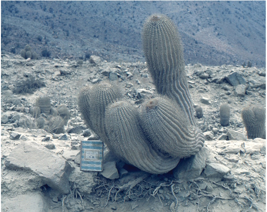
Figura 6. “Ejemplar de la cactácea Copiaoa sp. presente en abundancia en la terraza marina baja, a pocos metros sobre el nivel del mar, en el trayecto entre Taltal y Paposo, año 1981”.

el aparato en Cerro Moreno fue puesto a 1150 msnm, en Paposo fue solo a 750 msnm, pues aquí la montaña próxima solo tiene dicha altitud máxima. A mayor altitud (hasta aproximadamente los 1.100 msnm donde comienza hacia arriba la “capa de inversión térmica”), se da siempre una mayor productividad de acuerdo a nuestra experiencia.