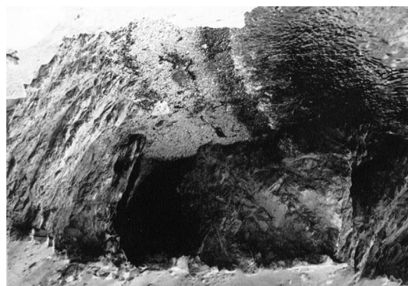
Figura 3. “Aguada de Cerro Moreno, diciembre de 1964”.