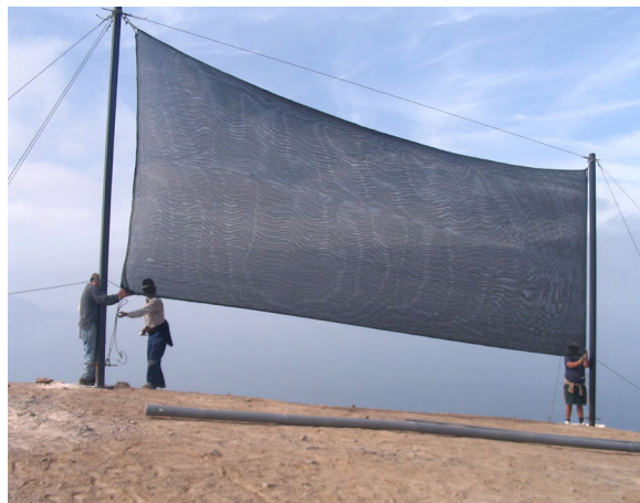
Figura 8. “Terminando de instalar un atrapanieblas de 40 m2 de malla raschel hacia los 800 msnm, en el oasis de niebla de Alto Patache, año 2007”.

En el campo del estudio de las nieblas costeras camanchacas, tanto en los cerros de El Tofo (región de Coquimbo, 1980-1984) como en Alto Patache (región de Tarapacá, 1997-2015) (figura 8), tuve la suerte de trabajar codo a codo con geógrafos como Pilar Cereceda de la Universidad Católica, ecólogos vegetales como Rodolfo Gajardo, climatólogos como Humberto Fuenzalida Ponce, ingenieros forestales como Guido Soto o ecólogos como Fernando Santibáñez, cuya experiencia en terreno trate de absorber