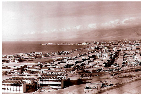
Figura 9. “Universidad del Norte sede Antofagasta, enero 1965”.