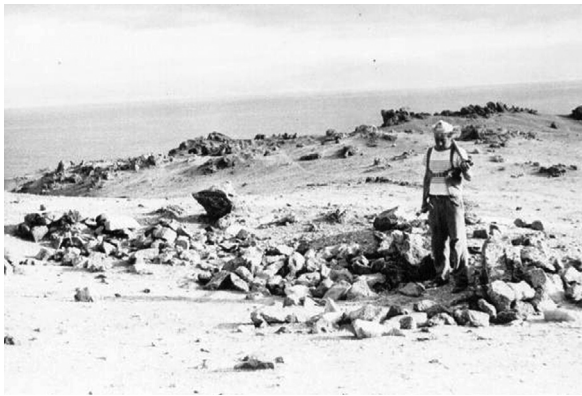
Figura 1. “Registro y documentación de los sitios arqueológicos de los pies de Cerro Moreno, diciembre de 1964”.

En primer lugar, mi interés por los changos y los primeros pescadores-recolectores marinos surgió del hallazgo casual, a partir de julio de 1963, de numerosos conchales arqueológicos al norte de la ciudad de Antofagasta (figura 1). Mis primeras salidas de excursión a la pampa aledaña a la ciudad, sin embargo, tuvieron por motivación un interés primariamente biológico y entomológico. Ni