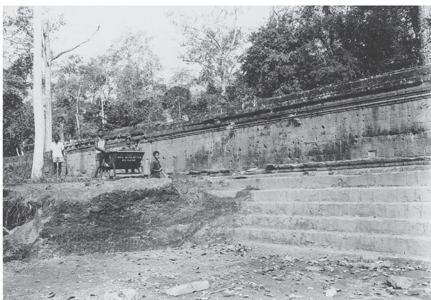
Fig. 2. Palais Royal, bassin nord-est : dégagement en cours des gradins (Ref. n° CAP7291)