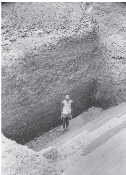
Fig. 3. Palais Royal, bassin nord-est : sondage jusqu'au fond de latérite (Ref. n° CAP7292)

l'imprécision de la chronologie céramique chinoise pour cette période, mais voit une trace supplémentaire de la prise d'Angkor en 1431 et de son abandon rapide dans le comblement délibéré du petit bassin qu'il avait partiellement fouillé en 1953 16 (sondage 2, *B.-P. Groslier fig. 1). Depuis la rédaction de ce rapport, de nombreux auteurs ont glosé sur ces sujets et, même si de nombreuses interrogations demeurent, il y aurait sans doute beaucoup à dire sur la période de l'abandon d'Angkor, sur les altérations de ses ouvrages hydrauliques, ainsi que sur la chronologie céramique et le