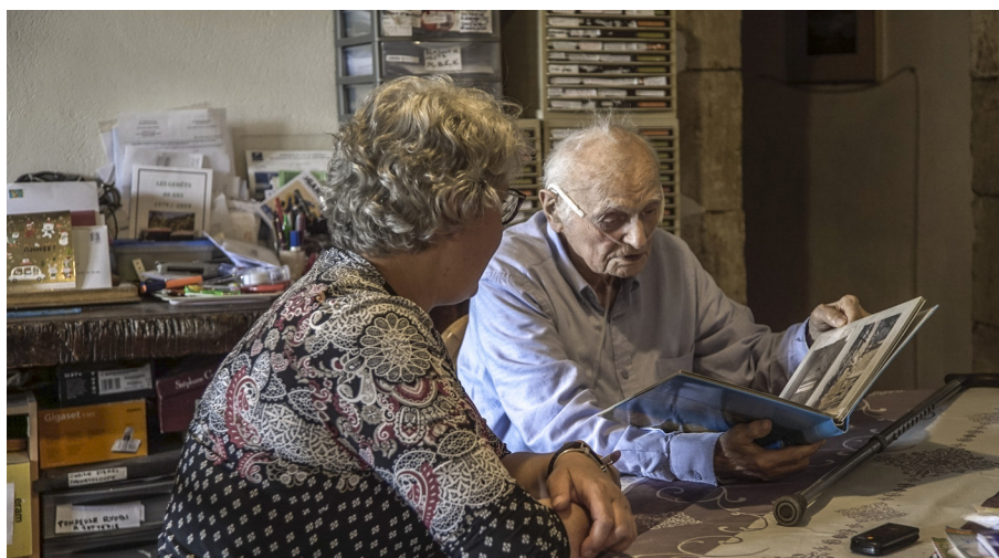
Images 2-4. Rencontres et d'observations de personnes âgées et/ou en situation de handicap à domicile.