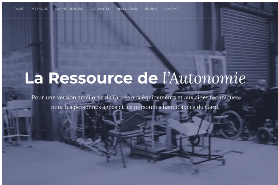
Image 5. Capture d'écran du portail web; < http://ressource-autonomie.fr/ >.