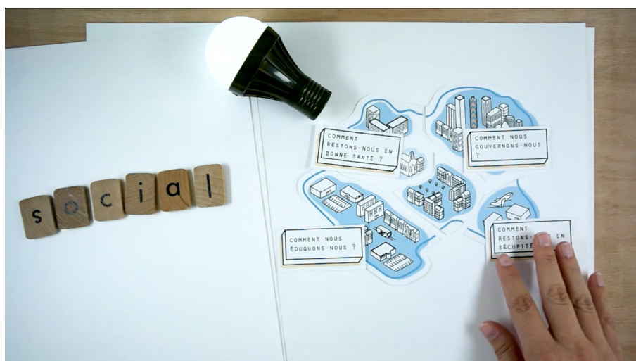
Image 6. Capture d'écran de la vidéo explicative sur les méthodologies du design social.

au plus grand nombre ; enfin, différentes communications et présentations du projet ont été effectuées.