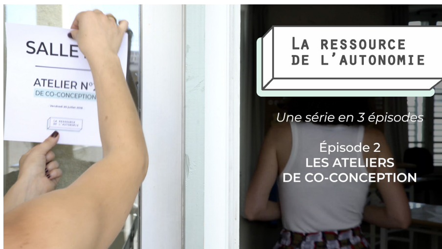
Image 7. Capture d'écran de la web série de La Ressource de l'Autonomie - Épisode 2 / Les ateliers de co-conception.

dynamique tant itérative qu'incrémentale. Elle a plusieurs vertus. D'une part, elle permet d'ancrer dans les pratiques l'idée selon laquelle il est possible de se tromper (on parle alors de « droit à l'erreur »). D'autre part, elle montre qu'il est souhaitable de prendre son temps en testant à petite échelle lors d'une première étape pour ensuite généraliser les dispositifs à plus grande échelle. Lorsque les actions concernent les politiques publiques et engagent les générations futures, ce temps pris ne semble pas superflu. L'expérimentation devient, ensuite, un outil utile, pour réduire l'incertitude et mesurer l'efficacité et les conséquences des actions développées. Avoir le droit à l'erreur, procéder par itération pour concevoir des solutions tant frugales que durables (Manzini et Jégou 2006), sur un temps long, dans une logique d'amélioration continue et de petits pas, voici ce qui structure la démarche du design social. Si l'étape d'expérimentations est utile pour ces projets, et plus largement pour l'action publique, il est toutefois important de ne pas en faire une solution miracle parée de toutes les qualités. Elle se heurte notamment à une limite concernant le passage à l'échelle. La montée en généralité doit en effet intégrer différents paramètres économiques, sociaux, politiques, environnementaux, qui souvent contrarient le déploiement des expérimentations dans d'autres lieux et à d'autres échelles.