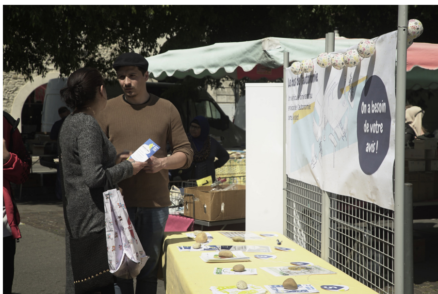
Image 9. Préfiguration du bus de l'autonomie sur un marché en Cévennes en compagnie d'ergothérapeutes.

La coordination pour les professionnels. Deux outils de coordination ont été expérimentés afin d'outiller les professionnels intervenant au domicile et d'améliorer les pratiques d'évaluation des bénéfices suite à l'installation d'aides techniques (Image 8).