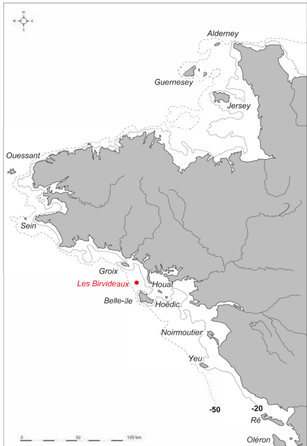
Fig. 1. Carte des principales îles du Ponant, avec indication en rouge de la position du plateau ou haut-fond d Birvideaux. Les lignes bathymétriques des -20 et -50 m sont signalées (DAO : G. Marchand).