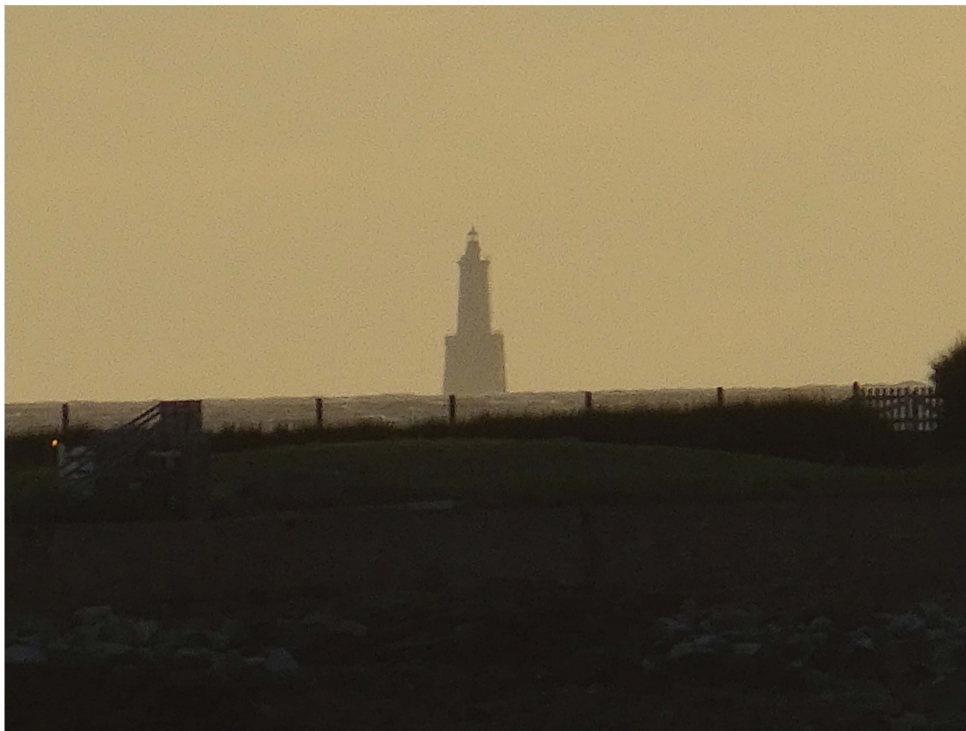
Fig. 4. Le phare des Birvideaux apparaît tremblotant au couchant, depuis le site de Beg-er-Vil. L'île était visible depuis cet habitat mésolithique, comme d'ailleurs du haut des falaises de Groix et de Belle-Île (Photo : G. Marchand).

Dans ce réseau de mobilité maritime, l'île des Birvideaux était inéluctablement un point d'appui apprécié. Le phare actuel est à 13,8 km à l'ouest de Beg-er-Vil, 14 km en bateau puisque l'on doit contourner la pointe de Beg-ar-Lann. Il est à 12 km au sud-ouest de Téviec. Bordelann sur Belle-Île est à 16,2 km vers le sud, à vol de goéland, mais un peu plus de 17 km par la côte en contournant la pointe des Poulains ou 15 km si l'on laisse son embarcation dans le fond actuel de la ria de Sauzon, en s'épargnant ainsi le franchissement d'un cap aux eaux mouvementées. Le Gorzed, qui trône au sommet des falaises sud de l'île de Groix, est à 22 km au nord-ouest des Birvideaux. Ces distances sont aisées à parcourir par mer calme en une seule journée, si l'on en croit certains référentiels ethnographiques (Ames, 2002 ; Rowley-Conwy et Piper, 2016). Au terme de cette brève inscription de l'île des Birvideaux dans son paysage du Mésolithique, on a révélé un potentiel de recherche certain, qu'il conviendra un jour prochain d'exploiter.