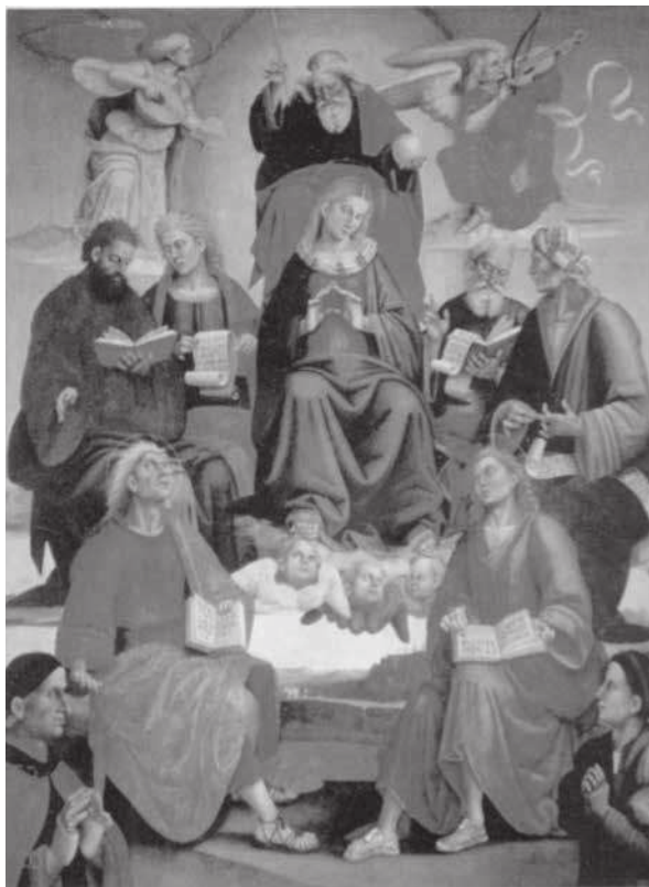
Figure 2. Francesco Signorelli, Pala (1524), Chiesa di Santa Maria al Calcinaio Cortona 8 .

de personnes présentes, puis parce que, loin d'être relégué en bas de la scène, il est presque au niveau de la Vierge, occupant une place à sa gauche.