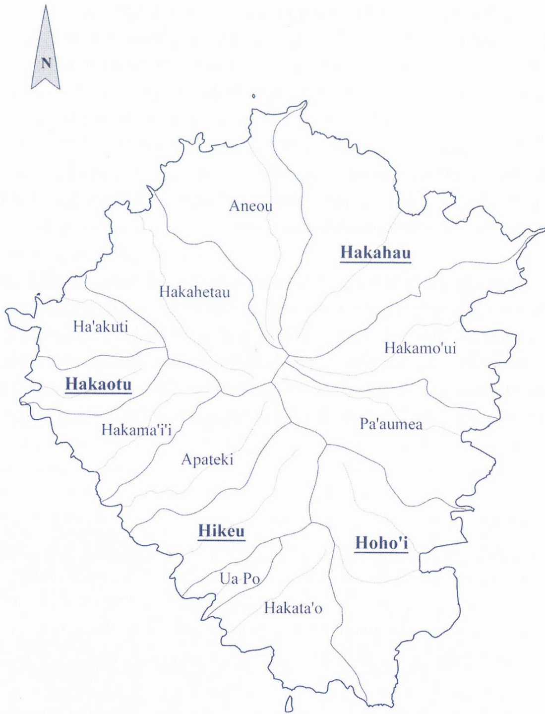
Carte de l'archipel de Ua Pou et situation des différentes vallées où ont été recueillies les versions de Lavondès (noms soulignés)