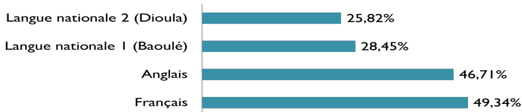
Figure 2 : Intentions d'élèves relatives à l'introduction de nouvelles langues dans l'enseignement en Côte d'Ivoire.

■ Intentions d'élèves sur l'avenir du français et la problématique de nouvelles langues officielles/langues d'enseignement en Côte d'Ivoire par M. Vahou (2018, pp. 160-165)