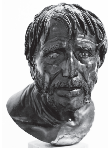
Fig. 1. Portrait dit du Pseudo-Sénèque découvert dans la villa des Papyri d'Herculanum. Musée Archéologique National. Naples. Inv. 5616, @ wikimedia commons

Ce lien conventionnel entre la figure du philosophe et la maigreur trouve une illustration particulièrement convaincante dans la représentation traditionnelle de Sénèque. Il existe en effet trois portraits dits “de Sénèque”. Pour deux d’entre eux, l’identification est fautive 11 . Pourtant, dès la fin du xvi e siècle, ce sont ces deux œuvres qui passèrent pour le portrait véritable de Sénèque et, encore aujourd’hui, malgré la découverte au xix e siècle d’une représentation contemporaine de la vie du philosophe, nombre d’éditeurs continuent à utiliser le “Pseudo-Sénèque” pour illustrer ses œuvres (fig. 1). La raison de ce mépris de la réalité archéologique est à rechercher du côté de la construction d’une représentation traditionnelle de Sénèque. D’un côté, nous avons deux portraits d’un personnage au corps maigre et ravagé par la vieillesse, conformes à l’image que la postérité s’est faite du sage stoïcien. Le portrait authentique, en revanche, présente le buste d’un personnage aux lèvres pleines et au visage charnu, évoquant davantage un homme jouissant de la vie qu’un ascète ou un sage (fig. 2). Cette représentation conventionnelle a perduré dans l’inconscient collectif, et dans certains dialectes italiens où le terme “seneca” permet encore aujourd’hui de désigner une personne maigre et malade 12 .