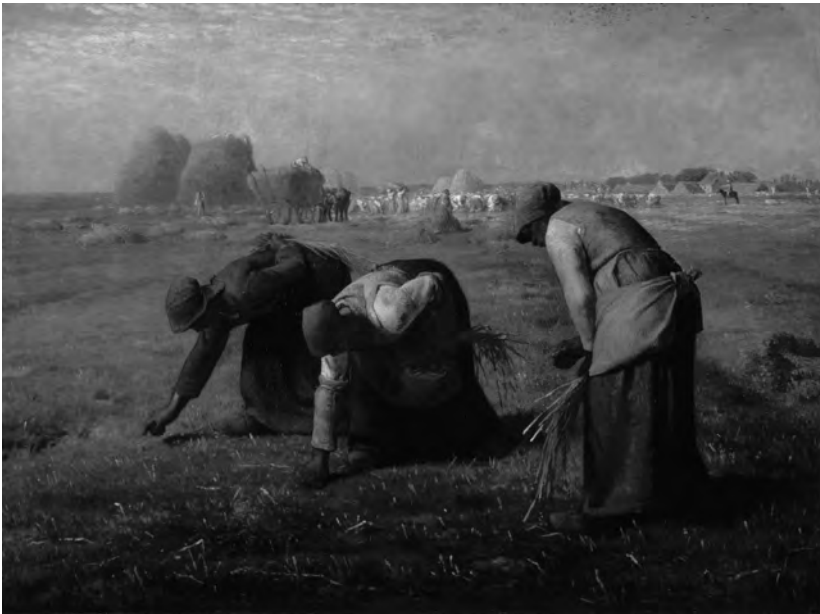
Figure 3. Jean-François Millet, Des glaneuses dit aussi Les glaneuses , 1857, huile sur toile, 83,5 x 110 cm, Paris, musée d'Orsay, ©Google Art Project 2.

L'autre part importante que les femmes ont pu jouer résultent des donations et legs faits au musée. Fondant sa fortune dans le négoce du champagne, Jeanne-Alexandrine Pommery achète ainsi Les Glaneuses de Millet pour 300 000 francs, afin d'empêcher ce tableau d'intégrer les collections américaines et en fait immédiatement don au Louvre en 1890 [fig. 3]. Par ce geste généreux, elle peut autant montrer son patriotisme qu'affirmer une fortune personnelle, fragilisée à l'époque par de multiples rumeurs sur de supposées difficultés financières.