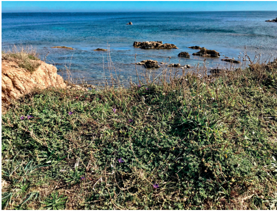
Figure 3. Habitat de Romulea arnaudii sur la presqu'île de Saint-Tropez (Var) : végétation halorésistante nitrophile et piétinée à Camphorosma monspeliaca , Lotus cytisoides , Plantago coronopus , Dactylis glomerata subsp. hispanica , avec Armeria arenaria s.l..