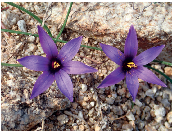
Figure 1. Romulea arnaudii Moret sur la presqu'île de Saint-Tropez (Var), le 19 février 2020.