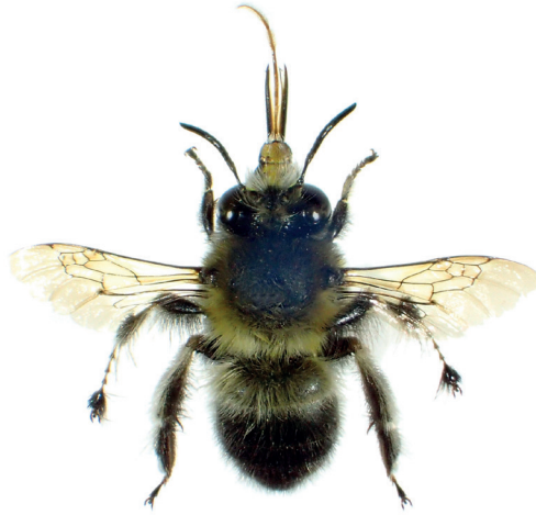
Figure 5. Anthophora dispar Lepeletier, 1841, spécimen mâle, de la presqu'île de Saint-Tropez (Var), le 19 février 2020.

Rhodanthidium sticticum (Fabricius, 1787) (Hymenoptera Megachilidae).