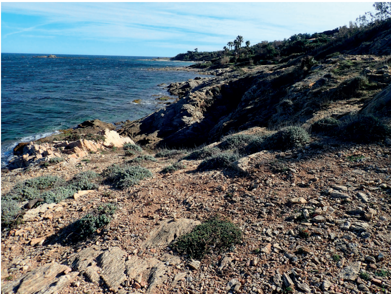
Figure 2. Habitat de Romulea arnaudii sur la presqu'île de Saint-Tropez (Var) : végétation halorésistante de pelouse rocailleuse littorale dominée par Helichrysum stoechas.

L'habitat de Romulea arnaudii se cantonne au liseré côtier, à quelques mètres tout au plus du bord de mer. L'espèce est essentiellement présente dans les pelouses rocailleuses silicicoles de la ceinture de végétation halorésistante composée soit d'une fruticée basse clairsemée à Helichrysum stoechas et Lotus cytisoides (Fig. 2), soit d'une communauté plus nitrophile à Camphorosma monspeliaca , Dactylis glomerata subsp. hispanica et Plantago coronopus (Fig. 3). La floraison de Romulea arnaudii sur la presqu'île de Saint-Tropez paraît avoir été très abondante et précoce en 2020 en raison des fortes précipitations automnales et de l'hiver 2019-2020 particulièrement doux. Ces conditions étaient donc favorables à l'objectif que nous nous étions fixé. Les populations de romulées étudiées le 19 février 2020, durant environ 6 h, se situent entre le cap des Salins et la pointe de la Rabiou. L'identification des insectes observés sur les fleurs de romulées ou volant à proximité immédiate a été réalisée soit par simple observation directe des insectes en vol, soit par photo, soit au laboratoire, après prélèvement au filet à papillons, pour les groupes les plus difficiles, à l'aide des ouvrages de détermination classiques (Audisio, 1993 ; Blatrix et al. , 2013 ; Guiglia, 1972 ; Intoppa et al. , 2009 ; Rasmont, 1995 ; Robineau, 2011 ; Schmid-Egger et al. , 2017).