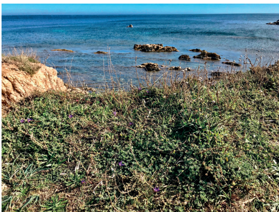
Figure 3. Habitat de Romulea arnaudii sur la presqu'île de Saint-Tropez (Var) : végétation halorésistante nitrophile et piétinée à Camphorosma monspeliaca , Lotus cytisoides , Plantago coronopus , Dactylis glomerata subsp. hispanica , avec Armeria arenaria s.l..