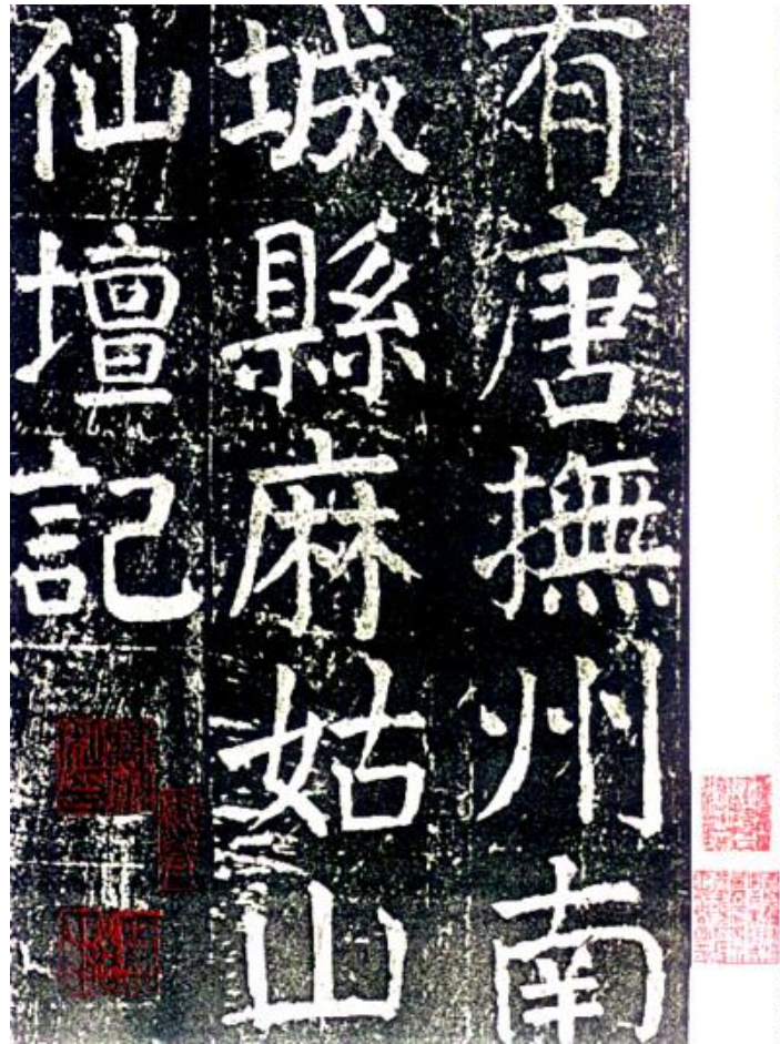
2. Yan Zhenqing (708-785), Annales de l'Immortelle Magu , 771, détail d'un estampage des Song, Pékin, musée de l'Ancien palais

Si la transmission picturale (ou calligraphique ou encore poétique) est basée sur la copie et l'imitation des œuvres des anciens, le but n'est pas la reproduction de formes à l'identique mais l'appropriation par chaque artiste des qualités morales des anciens, incarnées dans leurs peintures ou calligraphies. La copie correspond aux premiers pas du novice dans l'apprentissage et, même pour un artiste confirmé, elle demeure un très bon exercice. Intégrer les qualités d'un maître demande des années et provoque l'acquisition d'automatismes et d'habitudes dans le tracé qui sont ensuite difficiles à modifier lorsqu'on veut passer à l'apprentissage d'un autre maître. La « transmission par la copie », matérielle, ne parvient à une « transmission spirituelle » réussie qu'à la condition que le copiste ait le « cœur droit » ( zheng 正 ), qui est un principe tout autant technique, impliquant la