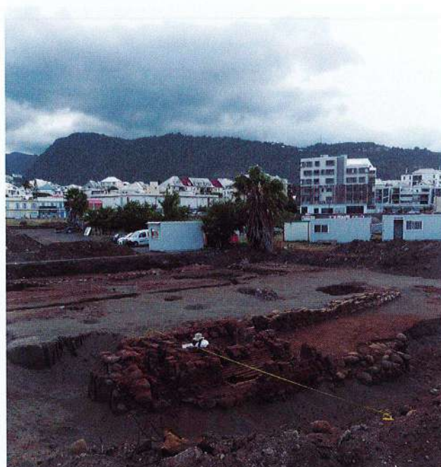
Fig. 4. La Réunion, le four du Quadrilatère Océan à Saint-Denis (2018).

un hospice, un pénitencier et une école professionnelle, est maintenant renseigné par un vaste diagnostic dans le parc actuel qui a révélé de nombreux vestiges, dont ceux de l'église.