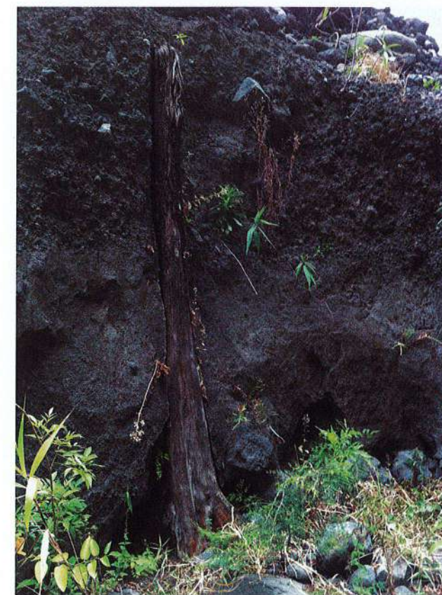
Fig. 3. La Réunion, un arbre de la paléoforêt de la Rivière des Galets (2013).

Le SRA, composé aujourd'hui d'un conservateur du patrimoine et d'un ingénieur d'études, bénéficie quant à lui du renfort de stagiaires et de vacataires, et du partenariat durable de l'association archéologies . Il définit en 2017 une première zone de présomption de prescription archéologique sur la commune de Saint-Paul, berceau du peuplement de l'île au XVII e siècle, permettant une meilleure prise en compte du patrimoine dans les projets d'aménagement.