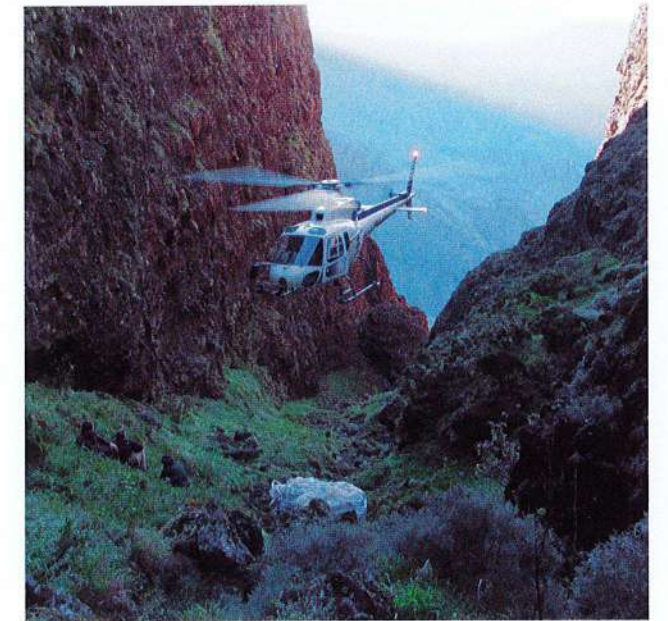
Fig. 1. La Réunion, expédition archéologique dans la « Vallée secrète » (2011).

Avec la « Vallée secrète », c'est une découverte aussi extraordinaire que singulière qui hisse les couleurs de l'archéologie insulaire. Il s'agit désormais d'explorer l'ensemble des Hauts, en lien avec les autres sciences qui en étudient le patrimoine culturel et naturel, et de comprendre l'occupation de ce territoire géographiquement identifié au cours d'un intervalle chronologique connu, c'est-à-dire des débuts du marronnage, au XVIII e siècle, jusqu'à l'optimum du peuplement créole des Hauts, à la fin du XIX e siècle, avant l'exode rural de la deuxième moitié du XX e siècle. Pour cela, la direction des affaires culturelles (DAC) de La Réunion noue des partenariats durables avec le parc national de La Réunion (PNRUN), le service régional de l'inventaire, ainsi que l'Office national des forêts, qui coordonnent leurs ressources et leurs expertises sur ce territoire complexe. Depuis 2018, un protocole d'enrichissement de la carte archéologique guide notamment les agents du PNRUN dans l'enregistrement d'observations sur le terrain et leur transmission au SRA.