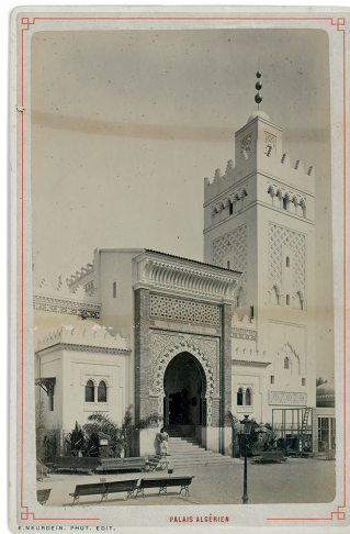
Fig. 6 Étienne Neurdein, Exposition universelle de 1878: Palais du Trocadéro , série de trois tirages sur papier albuminé, contrecollés sur carte album, ministère du Commerce, Archives nationales, F/12/SUPPL/624/96781/6B, pièces 14-1, 14-2 et 14-3.