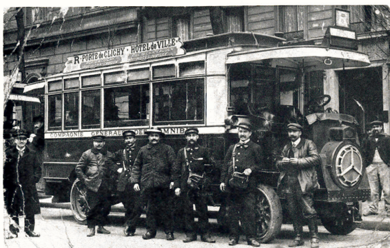
Personnel de la Compagnie Générale des Omnibus, devant l'autobus de la ligne R, avenue Victoria, vers 1900.