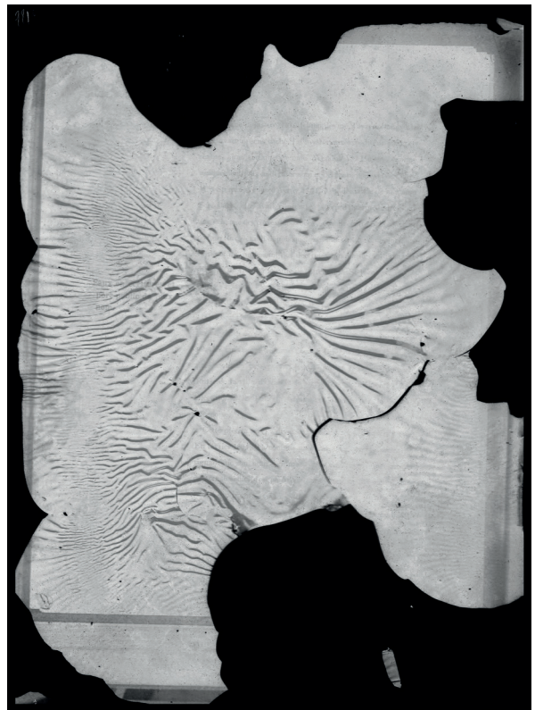
Fig. 8 Négatifs sur verre altérés éliminés au moment du traitement du fonds du service central photographique du ministère de l'Intérieur, cliché Archives nationales.