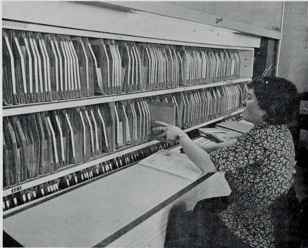
4. — Les dossiers thématiques.