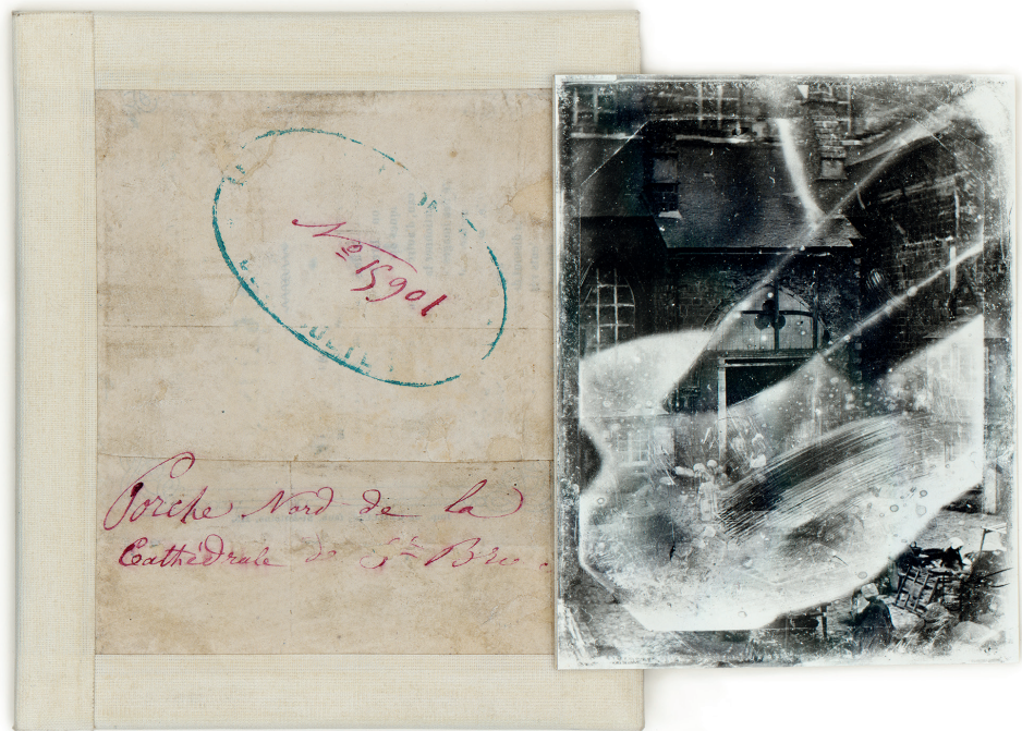
Fig. 2 Anonyme, Porche nord de la cathédrale de Saint-Brieuc , daguerréotype provenant d'un dossier d'instruction pour la restauration et les travaux des cathédrales, Administration des cultes, Archives nationales, F/19/7864/PHOTO, cliché Archives nationales.