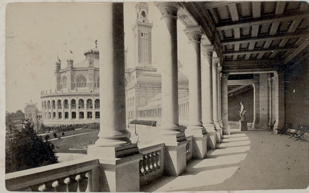
Fig. 5 Étienne Neurdein, Exposition universelle de 1878: Palais du Trocadéro , tirages collés en album, ministère du Commerce, Archives nationales, F/12/11909, cliché Archives nationales.