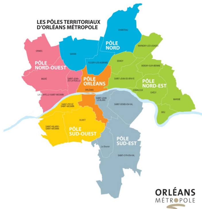
Figure 1 : les pôles territoriaux d'Orléans Métropole. Source : Orléans Métropole, 2019