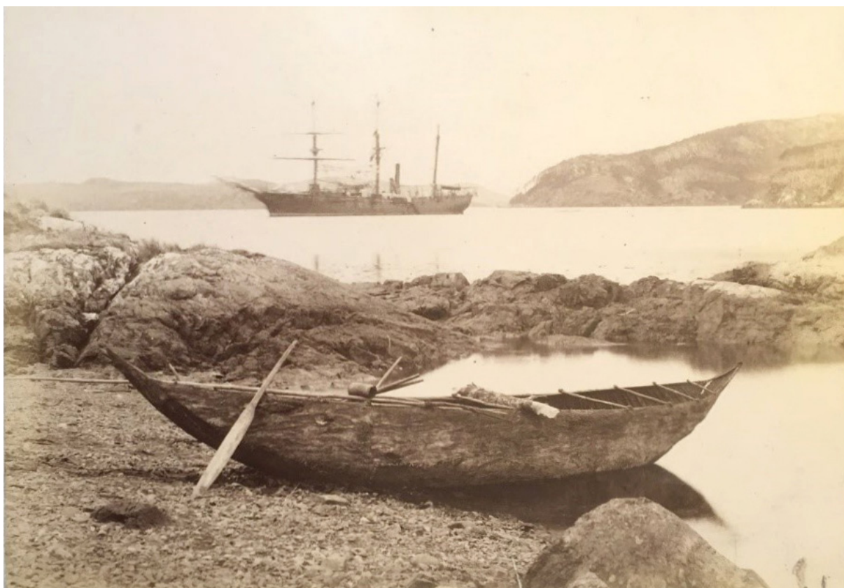
Figura 3. Misión Científica del Cabo de Hornos, 1882-1883. Pirogo remolcado en la playa frente a La Romanche anclado en Bahía Orange.

Julio Verne, La Magallania . Asimismo la expedición contribuyó a mantener el mito del Cabo de Hornos, de particular impacto en Francia, como se observa en la tradición de los cap horniers, todavía vigente en el Museo de los Capitanes del Cabo de Hornos, dedicado a los marineros que han navegado en esta región, instalado en una torre medieval de la ciudad de Saint Malo », en Bretaña.