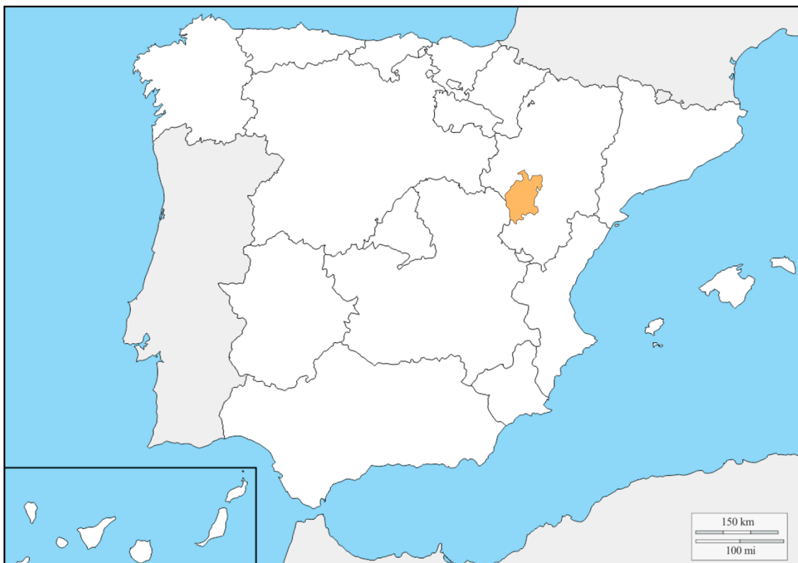
Figura 1. Extensión de la Comunidad de aldeas de Daroca dentro de Aragón. © Lidia C. Allué Andrés, a partir de http://d-maps.com

– salvo del quinto y del monedaje – a cambio del pago anual de 10000 sueldos jaqueses 4 . Quedaba así constituida oficialmente la Comunidad de aldeas de Daroca (fig. 1), la más antigua de las cuatro existentes en Aragón 5 .