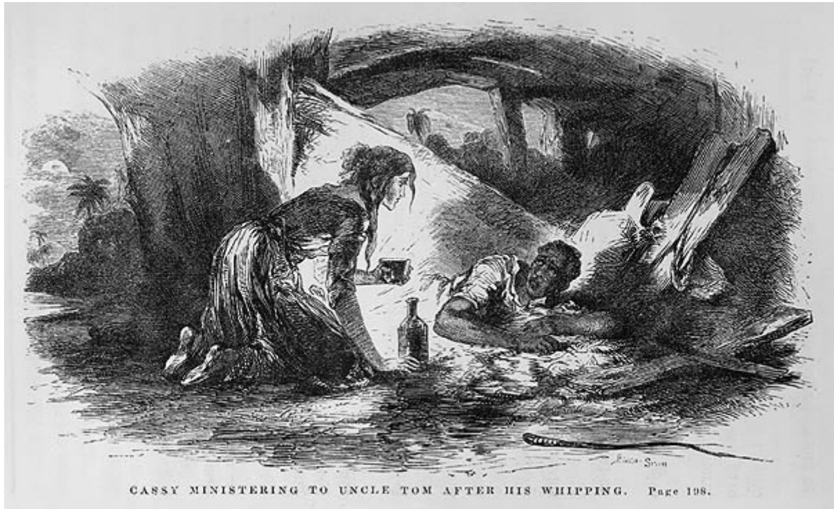
Fig. 2. Hammatt Billings, ill. pour Harriett Beecher Stowe, Uncle Tom's Cabin , Boston, John P. Jewett, 1853.