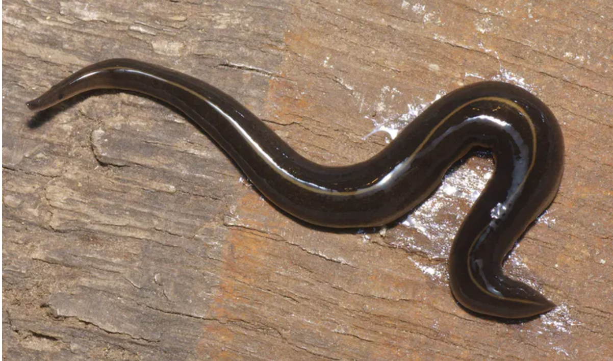
Le fameux Platydemus manokwari , qui maintenant envahit aussi la Guadeloupe. Pierre Gros

Platydemus manokwari a été trouvé pour la première fois à Manokwari, en Nouvelle-Guinée, et c'est probablement sa région d'origine. Il a ensuite envahi de nombreuses îles du Pacifique. Ce qu'on lui reproche, c'est qu'il mange pratiquement tout : les escargots, les vers de terre. Et dans les îles du Pacifique, les espèces d'escargots terrestres endémiques sont déjà en danger parce que rares et limitées à des petites surfaces. Platydemus manokwari peut mettre en danger la biodiversité des îles en détruisant les espèces rares de mollusques. Il est capable de chasser les escargots en suivant leur trace de mucus et peut même monter sur les branches des végétaux pour les pister !