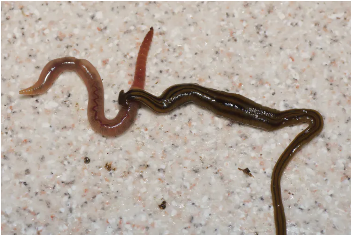
Le « ver à tête en forme de marteau » Bipalium kewense , le plus long des Plathelminthes envahisseurs des Antilles, ici en train de tuer un ver de terre. Pierre Gros

Commençons par le plus grand. Le « ver à tête en forme de marteau » Bipalium kewense est bien un géant : 30 centimètres – c'est plus long que votre chaussure, même si vous chaussez du 44. L'espèce s'appelle « kewense » ce qui signifie en latin qu'elle vient de Kew, en Grande-Bretagne, où elle a été décrite en 1878. En fait, elle vient plutôt des célèbres serres tropicales de Kew, qui abritent des plantes de tous les pays du monde. Voilà une des caractéristiques originales de ces Plathelminthes terrestres : souvent, ils sont passés inaperçus dans leur pays d'origine, et on ne les trouve que dans les régions qu'ils ont envahies. On a déterminé bien plus tard que la zone d'origine de Bipalium kewense est au Vietnam.