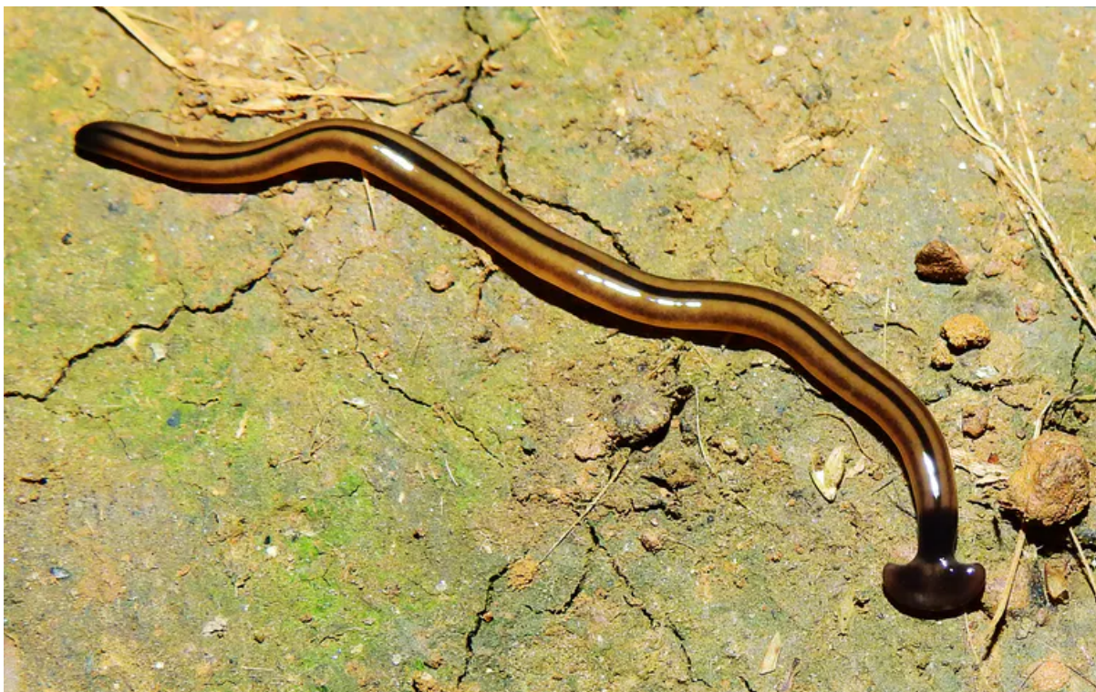
Le petit « ver à tête en forme de marteau » Bipalium vagum , présent en Guadeloupe et Martinique, photographié ici en Guyane Française.

Bipalium vagum a la même forme générale que Bipalium kewense , avec son corps allongé et sa tête large, mais il est beaucoup plus petit, pas plus de quelques centimètres de long, et les lignes sur son dos sont bien plus nettes. L'espèce n'a été décrite que très récemment, en 2005 ; le premier spécimen a été trouvé dans une jardinerie aux Bermudes. Comme pour tous les Bipalium , on pense que la région d'origine est en Asie, mais on ne sait pas où exactement.