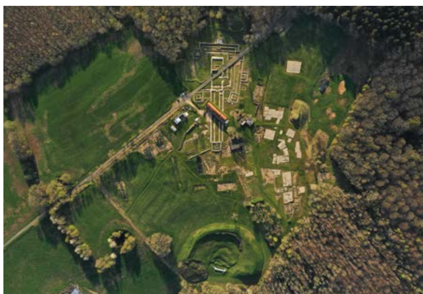
Eu, Bois l'Abbé, fig. 5 : le complexe monumental vu du ciel.

cette décennie d'exploration, ce site qui était qualifié de grand sanctuaire rural est reconnu comme une ville d'au moins 65 ha, dont le nom antique Briga nous a été révélé par la découverte épigraphique exceptionnelle dans la basilique en 2006 (Mantel, Dubois et Devillers 2006). Elle est dotée d'au moins un complexe monumental à sa périphérie ouest, dont les origines remontent à La Tène ancienne/moyenne en l'état actuel des connaissances. Ces recherches ont entraîné des avancées décisives pour la compréhension de cette agglomération de Gaule Belgique : précision de son assiette, caractérisation de son statut (un chef-lieu de pagus ), définition des principaux quartiers, compréhension de sa structuration