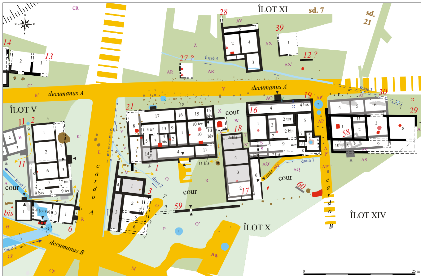
Eu, Bois l'Abbé, fig. 2 : plan interprété de la partie occidentale des vestiges centré sur les îlots X, XI et XIV du Quartier Nord, toutes phases confondues (É. Mantel, DAO : J. Parétias).

Dans ce quartier (plus particulièrement l'îlot X du sondage 7), une fondation linéaire (59) marquant une limite de parcelle, quelques segments de murs de possibles bâtiments (12 ?, 60) ainsi que des structures en creux ont été mis au jour et complètent le plan général des vestiges (fig. 1 et 2). Ces renseignements complémentaires confortent le schéma proposé depuis plusieurs années pour l'implantation et l'évolution de la trame urbaine des II e et III e siècles (Mantel et Dubois 2012) et précisent son organisation. L'existence d'espaces de cours quadrangulaires communs dans l'îlot X délimités par un mur (espaces Q/R) et une clôture (espaces AQ/AQ'/AQ'') est désormais attestée. L'approvisionnement en eau est de mieux en mieux appréhendé par la mise en évidence de l'utilisation des points d'eau (puits et puisards), avec pour certains emplacements jusqu'à 2 ou 3 creusements successifs (espaces AC' et AP'). Les données acquises cette année apportent des précisions sur la structuration du quartier et affinent la chronologie des différents aménagements comme les plans de phasage de l'occupation.