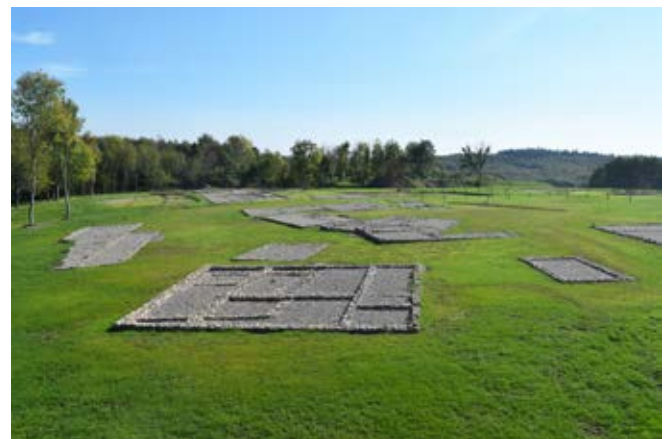
Eu, Bois l'Abbé, fig. 3 : vue vers l'est depuis la butte panoramique du Quartier Nord mis en valeur (M. Richard).

cadre environnemental préservé de la clairière du Bois-l'Abbé. L'aménagement d'une butte panoramique dans le Quartier Nord et l'engazonnement des espaces de circulation (voiries, cours) permet de renforcer la lisibilité des vestiges dont les fondations ont été partiellement complétées et, dans certains cas, rehaussées. Ce procédé de valorisation, qui permet enfin l'accessibilité des vestiges à une grande partie de la population, a été accueilli de manière très positive par les instances (SRA, CRMH, Conseil Scientifique) et emporte l'adhésion des visiteurs. Il pourra à l'avenir être systématiquement