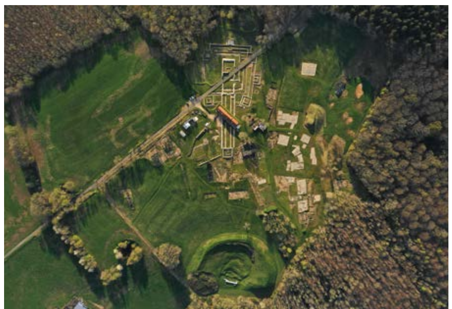
Eu, Bois l'Abbé, fig. 5 : le complexe monumental vu du ciel.

cette décennie d'exploration, ce site qui était qualifié de grand sanctuaire rural est reconnu comme une ville d'au moins 65 ha, dont le nom antique Briga nous a été révélé par la découverte épigraphique exceptionnelle dans la basilique en 2006 (Mantel, Dubois et Devillers 2006). Elle est dotée d'au moins un complexe monumental à sa périphérie ouest, dont les origines remontent à La Tène ancienne/moyenne en l'état actuel des connaissances. Ces recherches ont entraîné des avancées décisives pour la compréhension de cette agglomération de Gaule Belgique : précision de son assiette, caractérisation de son statut (un chef-lieu de pagus ), définition des principaux quartiers, compréhension de sa structuration