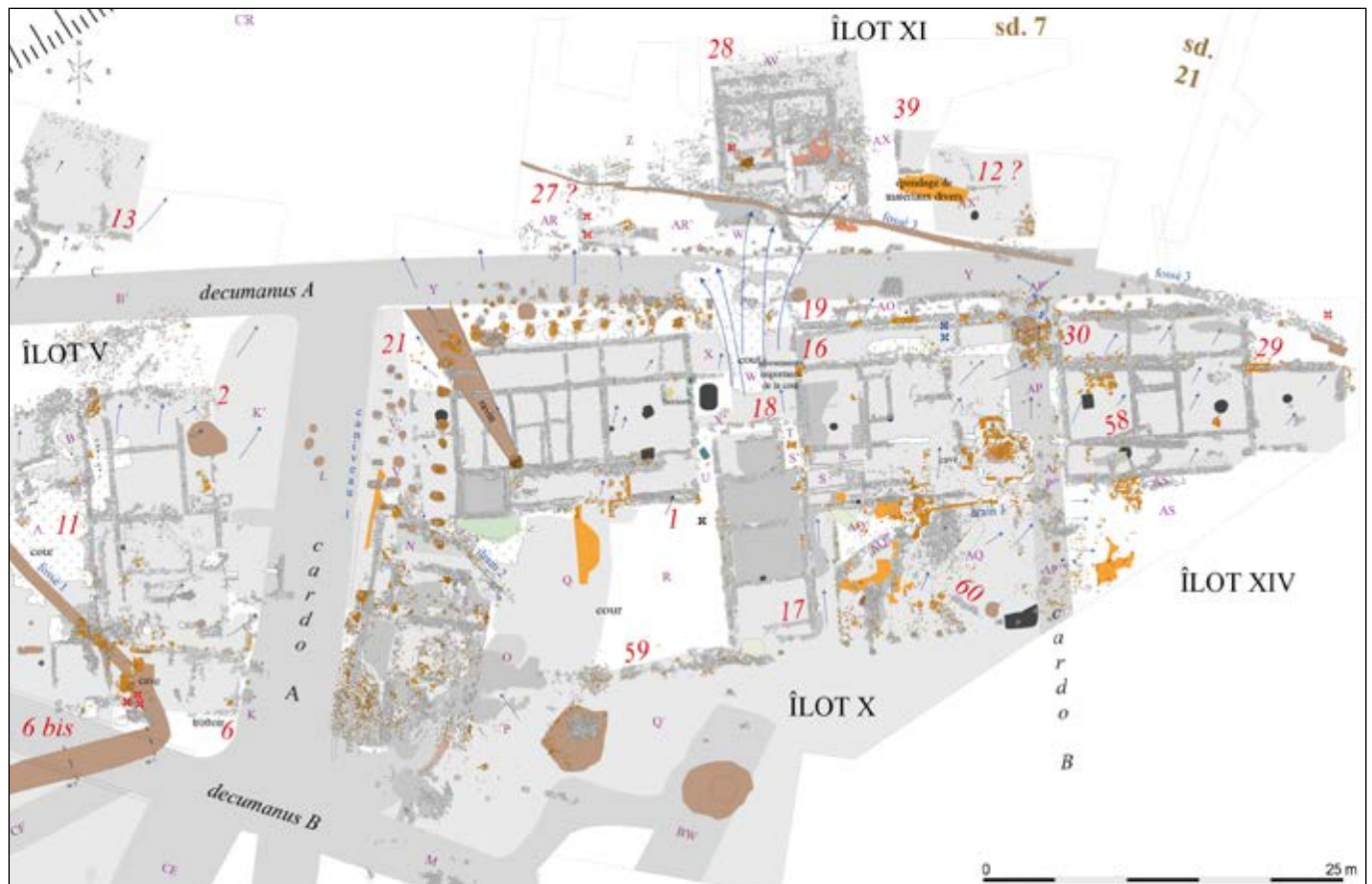
Eu, Bois l'Abbé, fig. 1 : relevé pierre à pierre de la partie occidentale des vestiges centré sur les îlots X, XI et XIV du Quartier Nord (relevé : G. Blein, S. Boireau, A. Dananai, L. Deschamps, É. Mantel, J. Nguyen-Dao, J. Parétias, DAO : J. Parétias).

La période protohistorique est elle aussi de mieux en mieux documentée par cette approche méthodologique à grande échelle. Du mobilier remanié a été découvert dans le sondage 7 (presque exclusivement au sud du Decumanus B, mais aussi dans l'espace AQ) et la majorité provient du sondage 8 (principalement dans les espaces BL, BK, CE et CH). L'étude du mobilier céramique protohistorique et de sa répartition (1 170 tessons supplémentaires, 102 individus) contribue à mieux appréhender ces horizons chronologiques et les mouvements de remblais de plus en plus évidents, consécutifs à certains aménagements surtout effectués de la fin du I er siècle au milieu du III e siècle de notre ère.