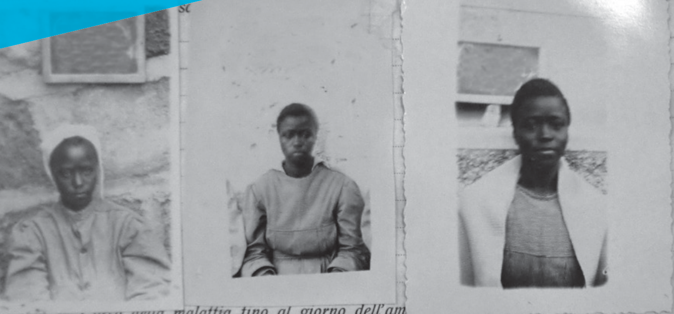
inizio. — Corso ueua malattia fino al giorno dell'am

Anamnesi familiare — Anamnesi individuale. — Infanzia — Abilità, istinti,