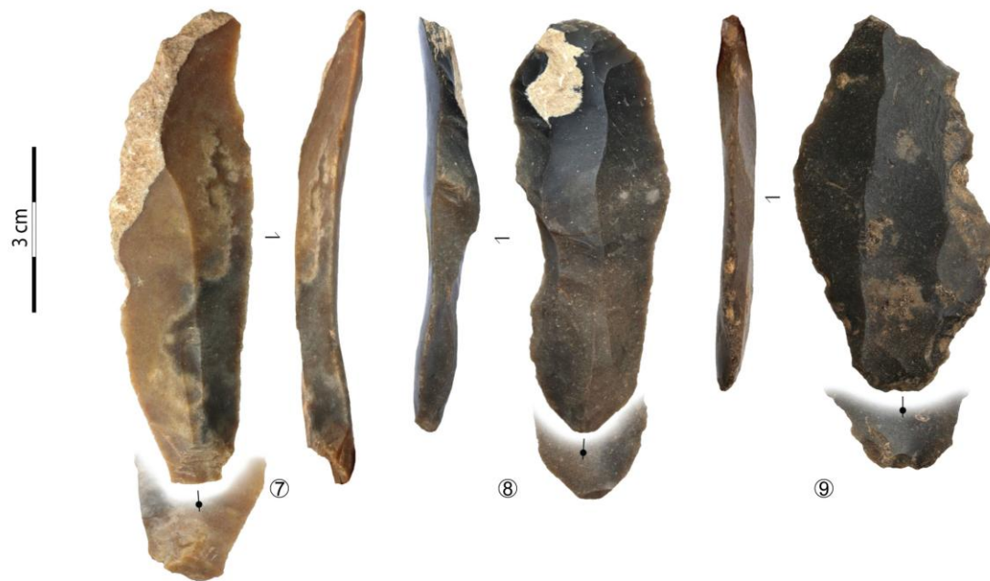
Figure - Exemples d'armatures lithiques (microlamelles à dos envahissant, n os 1-6) et de lames (7 : lame brute, 8 : grattoir sur lame, 9 : lame retouchée) ; dessins C. Fat Cheung, photos ML, CAO SD & ML.