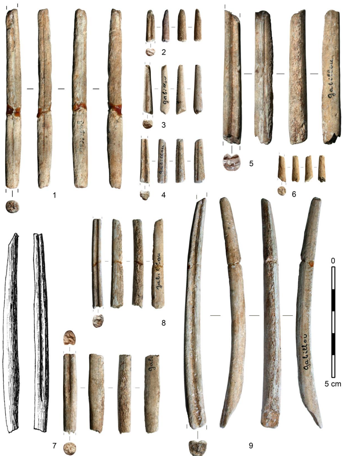
Figure - Armatures en bois de cervidé à base pleine et rainurées (n°7 : à gauche, dessin de l'objet d'après Gaussen, 1964 ; à droite, état actuel après prélèvement pour datation ^{14}\text{C} ), CAO JMP