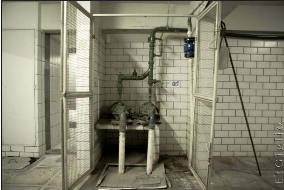
Photo 2. Puits situé dans le garage souterrain d'un immeuble de Boa Viagem

et l'électricité. Les importants volumes d'eau fournis et surtout la certitude d'avoir un accès à l'eau amortissent rapidement l'investissement initial.