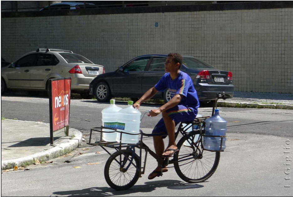
Photo 4. Livreur d'eau en bouteille à Boa Viagem