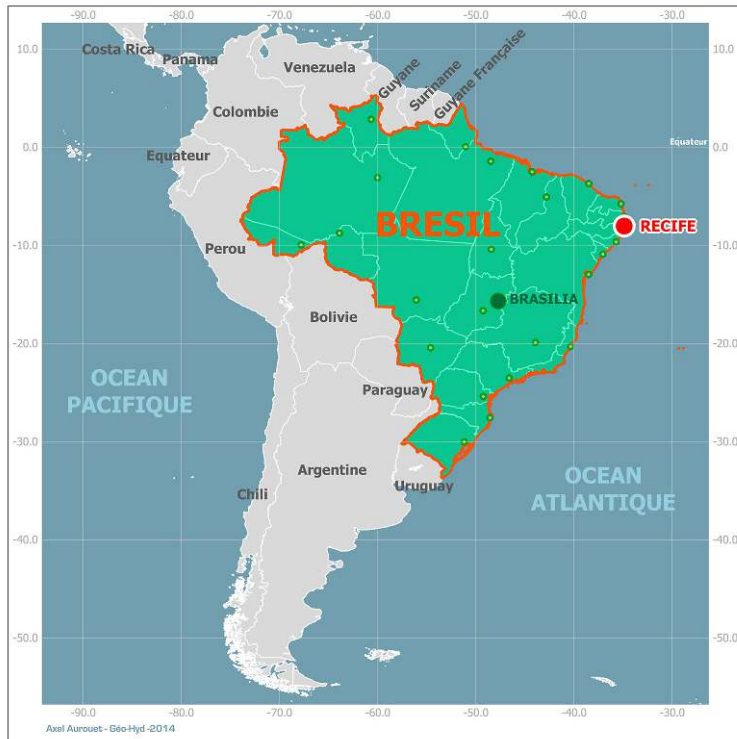
Carte 1. Localisation de Recife