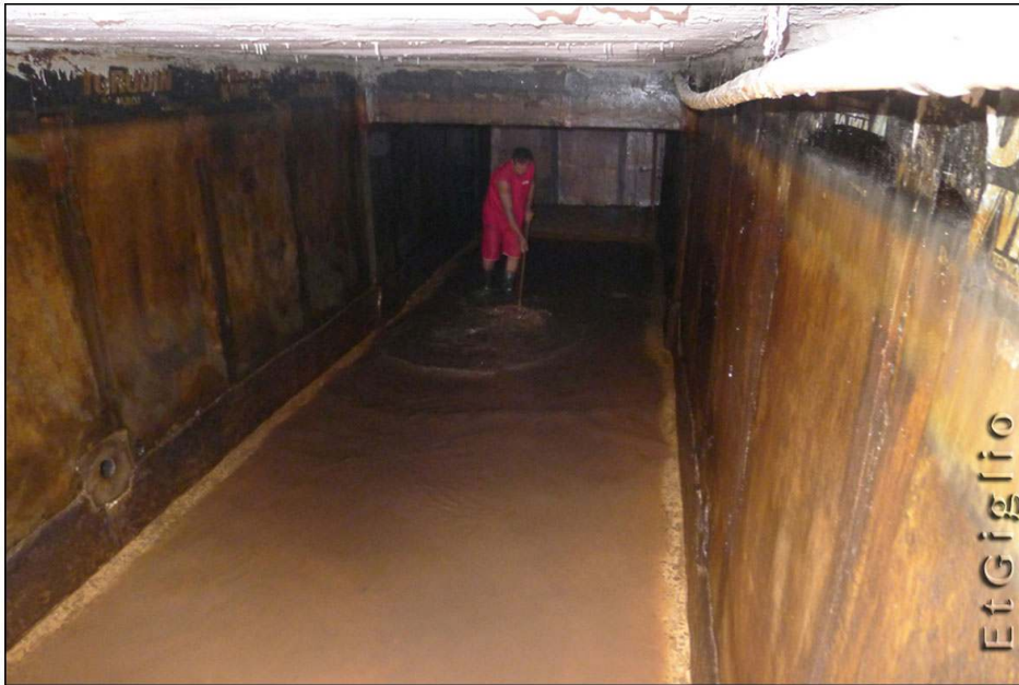
Photo 7. Citerne souterraine d'immeuble vidée pour son nettoyage à Pina