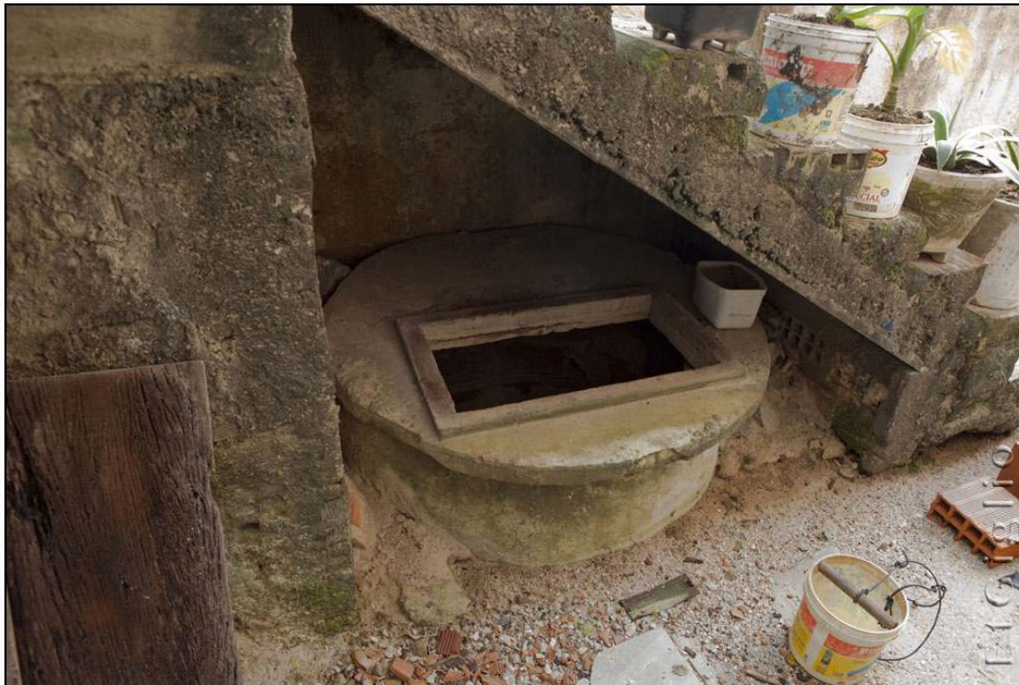
Photo 3. Caçimba à usage individuel située dans la cour d'une maison à Brasília Teimosa