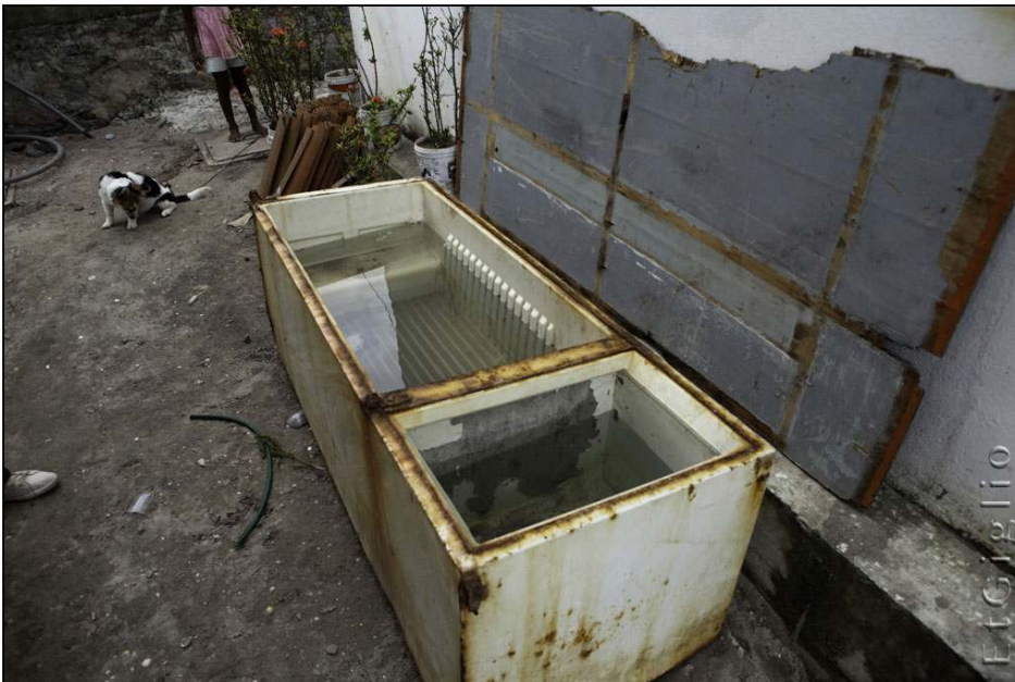
Photo 8. Frigo servant au stockage individuel de l'eau à l'Ilha de Deus