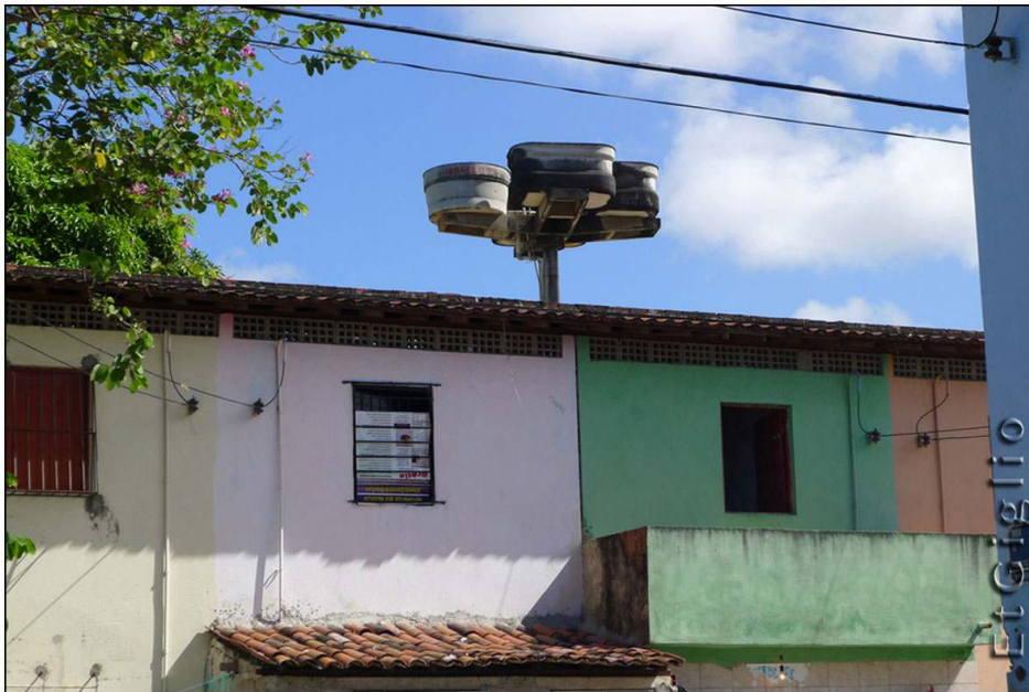
Photo 6. Citernes de toit à Campina do Barreto