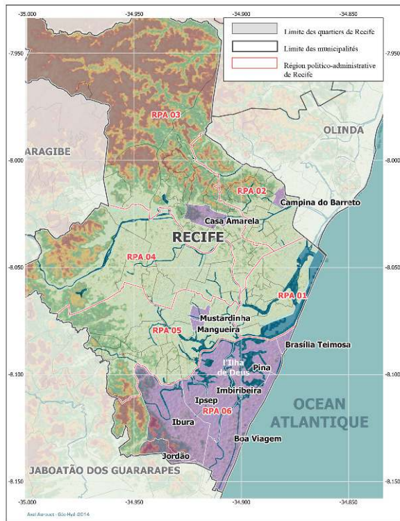
Carte 2. Les quartiers de l'enquête