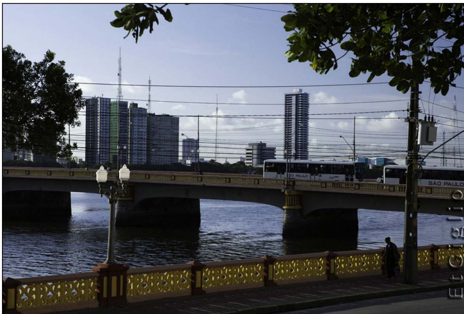
Photo 9. Le fleuve Capibaribe au centre de Recife