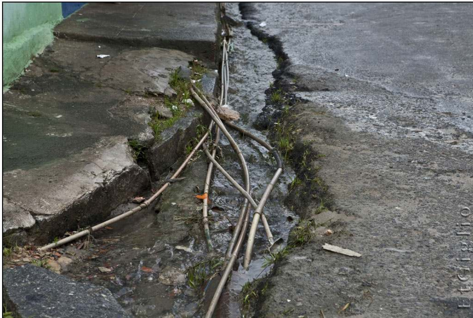
Photo 1. Branchements clandestins d'eau courant le long du caniveau à Ibura