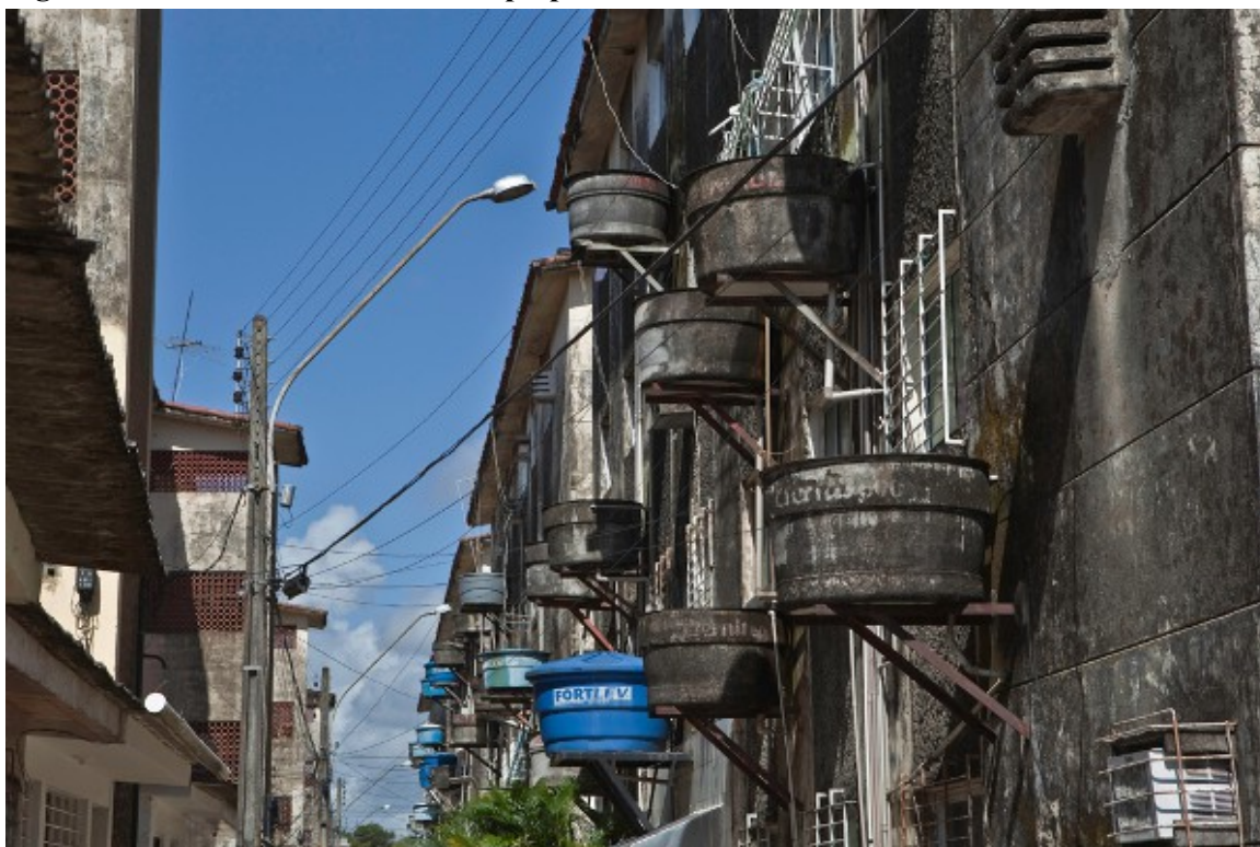
Figure 1. Ensemble habitational à Ipsep

Face à l'intermittence, les habitants ont développé de multiples stratégies d'adaptation. Le stockage de l'eau en est un élément déterminant et selon le niveau social les citernes et autres contenants sont plus ou moins visibles, diversifiés et encombrants ( cf. figures 1, 2 et 3). Les puits qui pompent la nappe contaminée superficielle (figure 4) ou les nappes profondes ont également connu un développement spectaculaire (au moins 13 000 recensés avec un pic dans les années 1990). Au-delà du confort quotidien qu'ils procurent, ils apparaissent à leurs propriétaires comme des stocks permettant de ne pas dépendre des rondes des camions-citernes dont le ballet s'accélère quand l'eau vient à manquer.