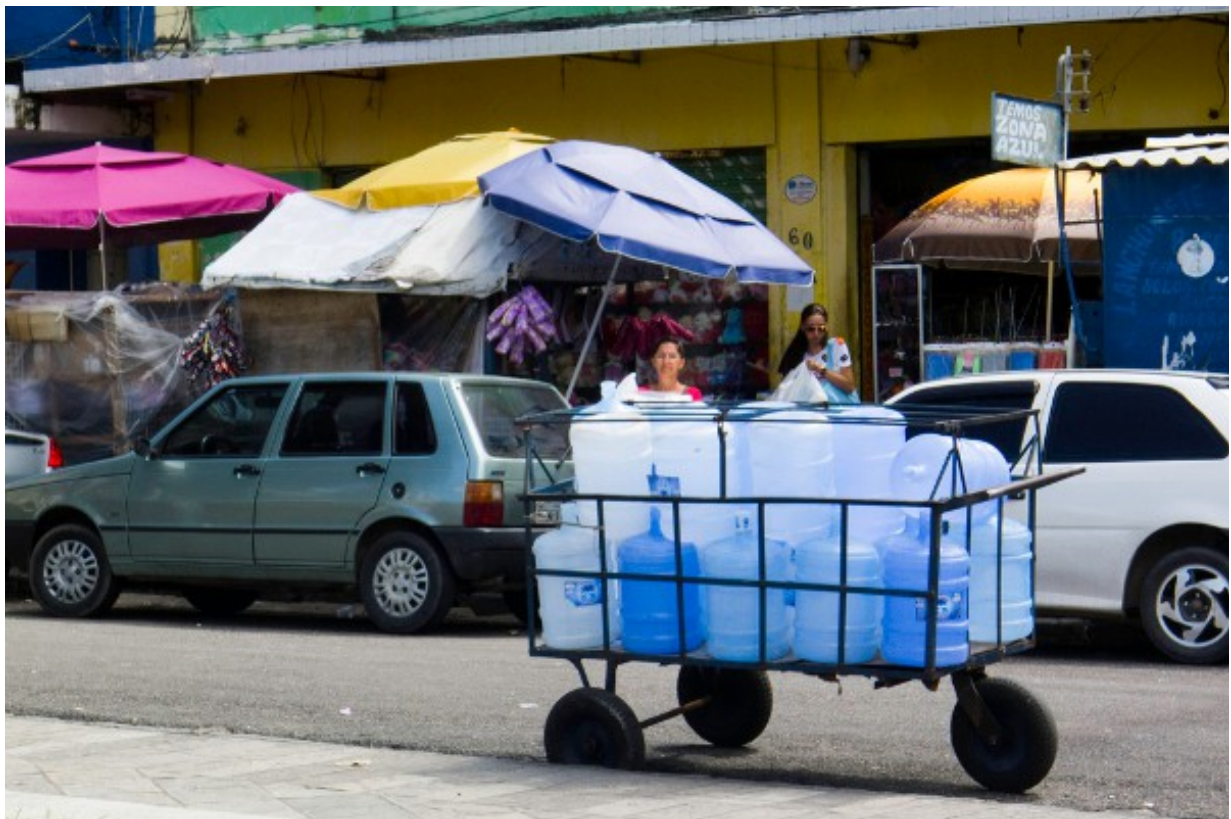
Figure 5. Bonbonnes dans le centre de Recife

Cette absence de mobilisation s'explique par l'inertie provoquée par les décennies de mauvais fonctionnement du réseau public et par les alternatives qui se sont développées. Le Pernambuco se positionne ainsi aujourd'hui comme le second État fédéré du Brésil en matière de production d'eau embouteillée. Cette production présente une large gamme de bonbonnes de 20 litres (courantes dans tous les milieux sociaux ; cf. figure 5), dont les prix varient fortement suivant les marques. De même, de nombreuses entreprises de livraison par camion-citernes (cf. figure 6) continuent à fonctionner, alors même que l'application de la loi sur les débits maximaux des puits aurait dû conduire à leur interdiction. D'autres secteurs florissants (machines de désalinisation par osmose inverse, entretien des puits, distribution de l'eau à domicile, etc.) pâtiraient de l'application de la loi.