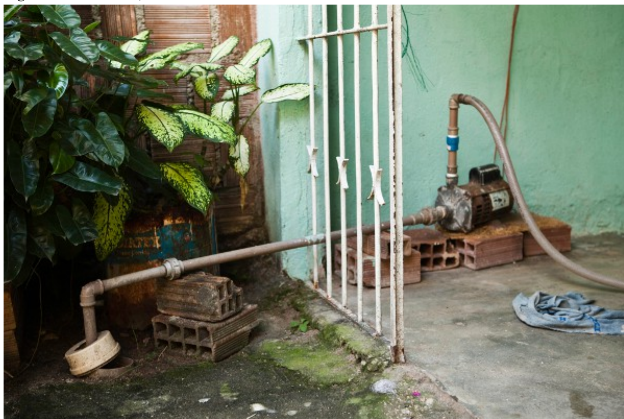
Figure 4. Vila do Sesi, à Ibura