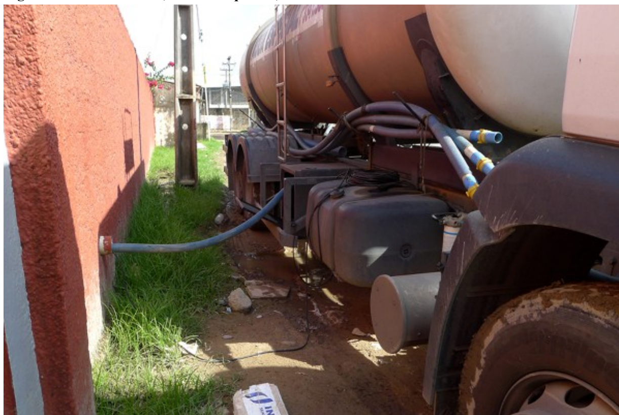
Figure 6. Camion-citerne, favela Coqueiral, à Imbiribeira