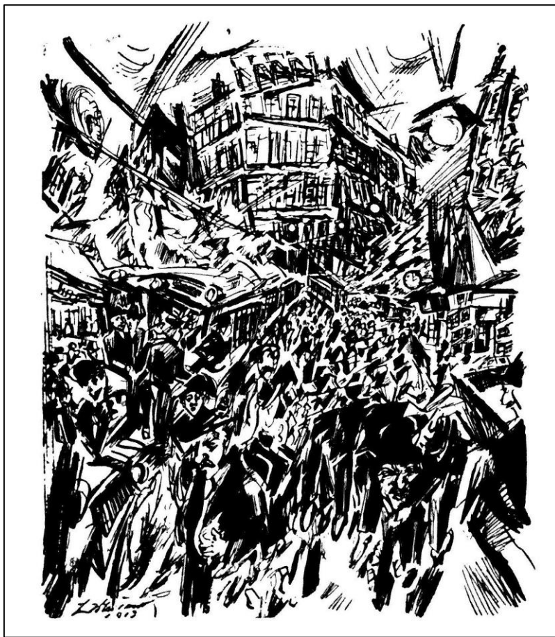
Abbildung 2. Ludwig Meidner, Potsdamer Platz , Die Aktion 44/45, 7. November 1914

In der Zeichnung „Potsdamer Platz“ 59 [Abb. 2] erreicht die Zersplitterung der Stadt ihren Höhepunkt. Die diagonalen Linien führen den Blick des Betrachters ins Zentrum des Platzes, von dem aus urbane Elemente und Figuren herausströmen. Anonyme, gesichtslose Menschen, dicht zusammengedrängt, schreiten mechanisch vorwärts, während eine überfüllte Straßenbahn auf der linken Seite umzukippen droht. Im Hintergrund hebt sich ein fünfstöckiges Hochhaus vom Gedränge ab, das nah am Bersten ist.