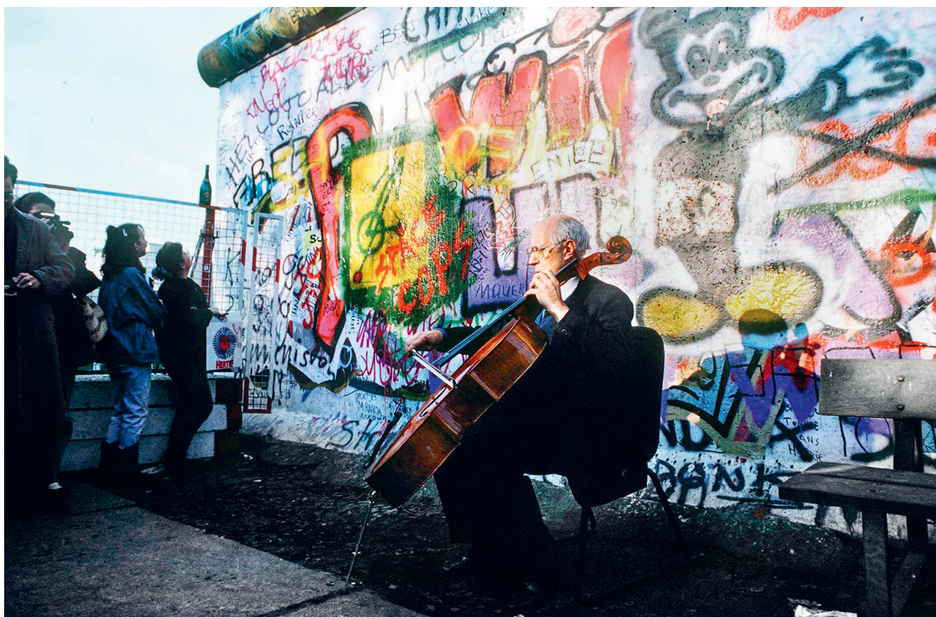
Mstislav Rostropovich jouant un morceau de Johann Sebastian Bach devant le mur de Berlin, non loin de Checkpoint Charlie, 9 novembre 1989.