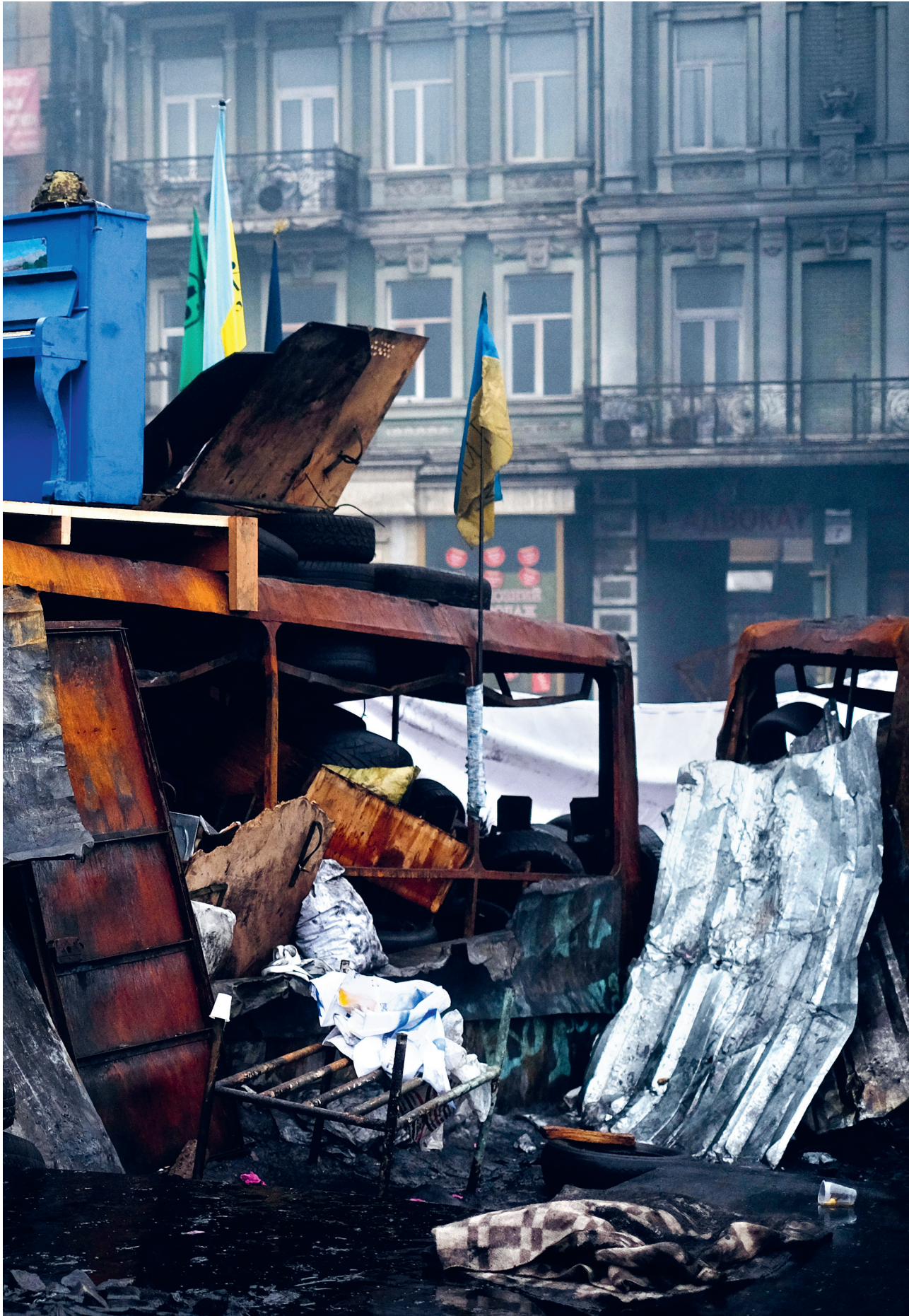
Pianiste lors de la bataille de Maidan, Ukraine, 2014