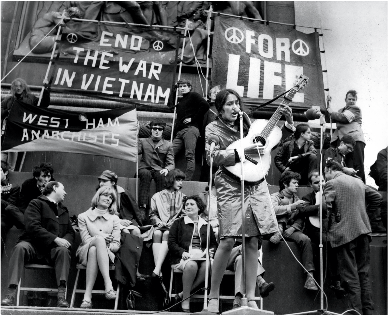
Manifestation pour la paix au Vietnam à Trafalgar Square. Joan Baez en concert, 5 mai 1965 (détail).