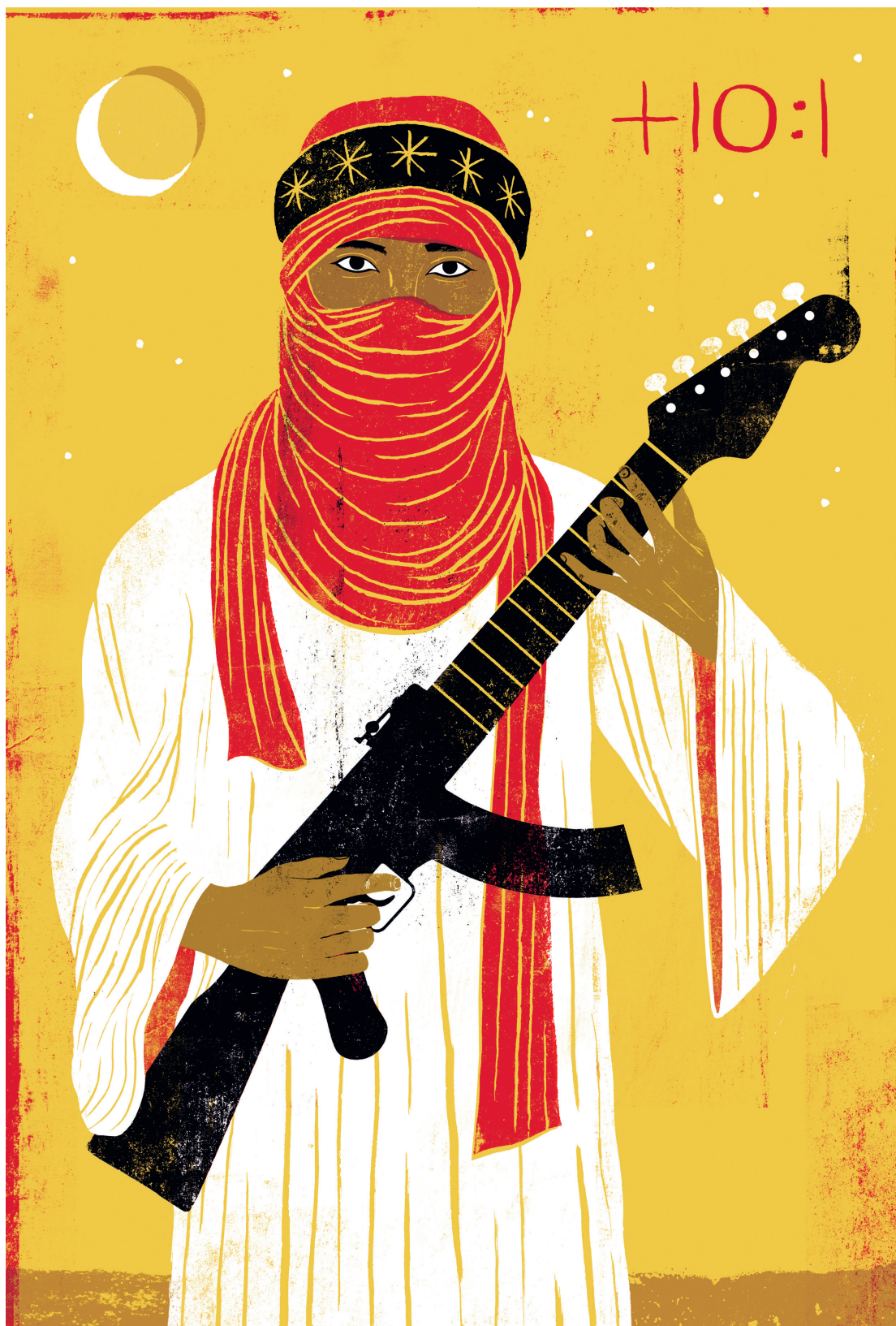
Adrià Fruitós, Tuareg's banishment , 2014.