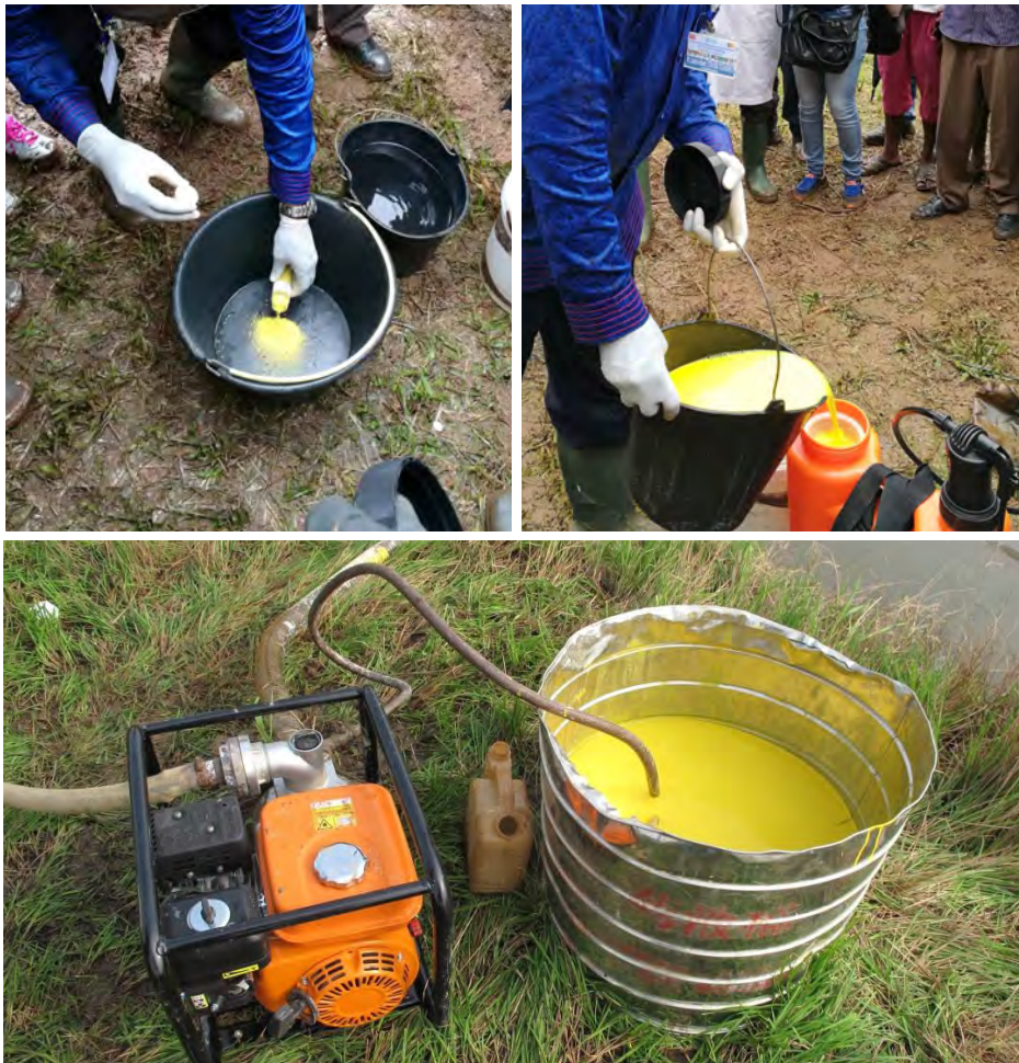
Figure 3. Préparation du molluscicide

Les fabricants recommandent que le niclosamide soit conservé dans son récipient d’origine fermé, dans un lieu frais et sec, loin des produits alimentaires et hors de la portée des enfants. Si le niclosamide est utilisé conformément aux recommandations fournies sur l’étiquette, il est peu probable qu’il génère un danger pour l’Homme. L’eau traitée par niclosamide peut être utilisée pour irriguer les cultures, comme cela a été établi pour des cultures de bananes, de coton, de sucre de canne, de blé, de maïs, d’agrumes, de haricots, de riz, de lentilles, d’orge et d’arachides. Le