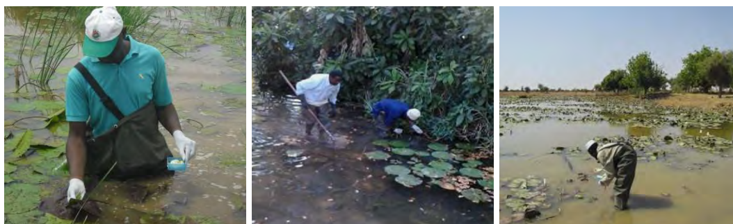
Figure 5. Échantillonnage de mollusques aquatiques

Il existe différentes approches pour vérifier l'efficacité de l'application de molluscicides ; même s'il est possible de déterminer la concentration de l'eau en niclosamide (Strufe, 1962), cette démarche est rarement nécessaire dans le cas d'une application focale où seules de petites quantités de produits chimiques sont appliquées périodiquement.