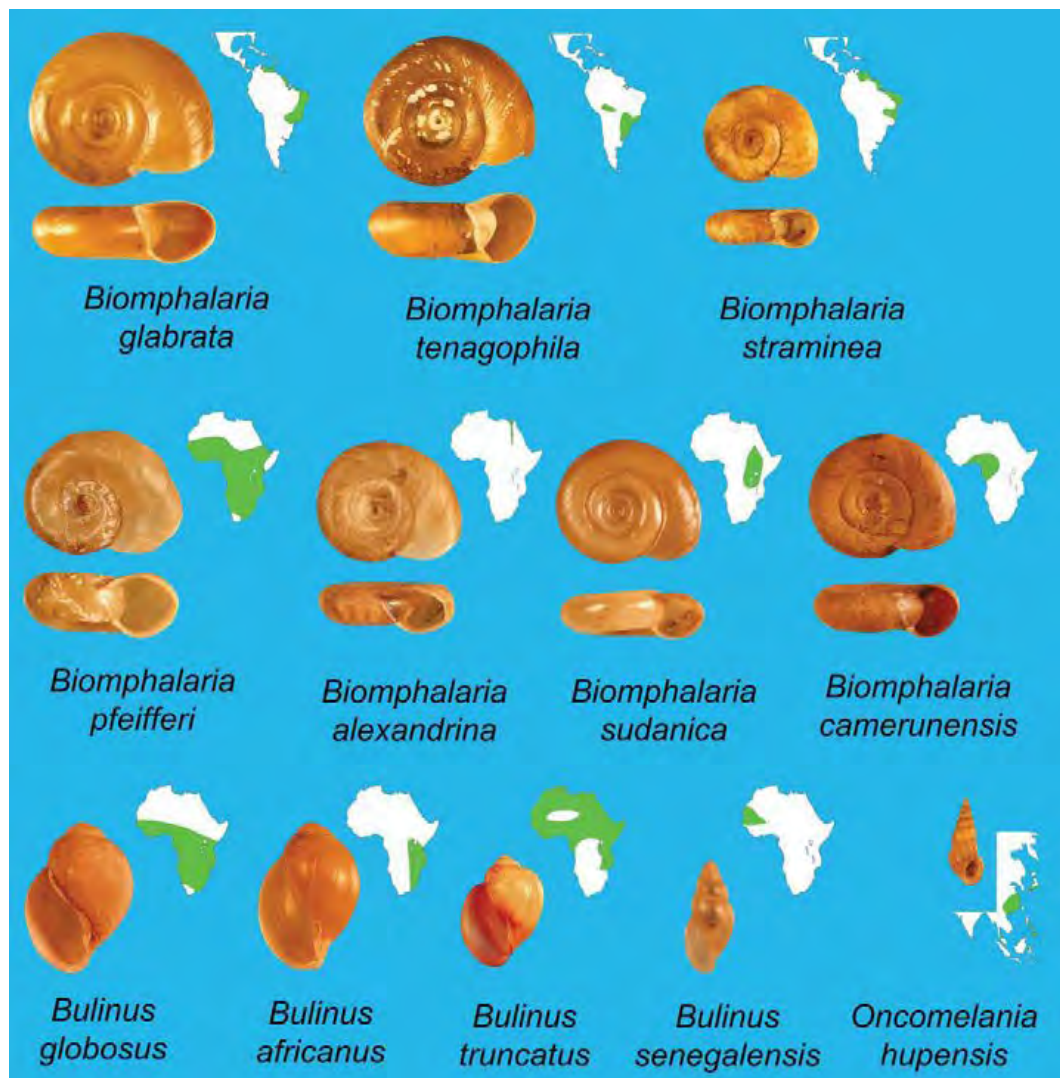
Figure 1. Espèces de mollusques hôtes intermédiaires d'importance majeure dans le monde (adaptation par le Dr H. Madsen d'un ensemble de diapositives de l'Organisation mondiale de la Santé (1989) intitulé « The intermediate snail hosts of African schistosomiasis. Taxonomy, ecology and control »)

La lutte contre les mollusques améliore aussi la prise de conscience sur la maladie au sein de la communauté et offre des opportunités pour renforcer les interventions d'éducation sanitaire parallèlement à la chimiothérapie préventive.