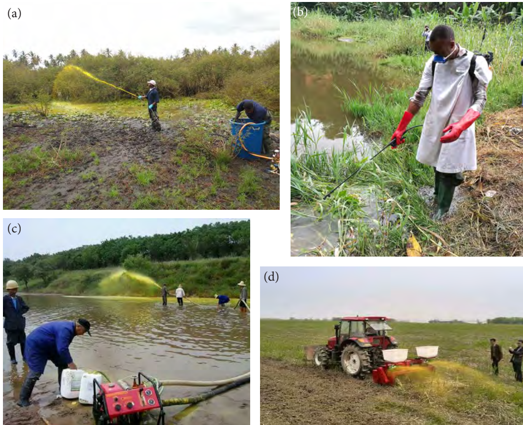
Figure 4. Équipes de lutte contre les mollusques en train d'appliquer du niclosamide à Zanzibar (République-Unie de Tanzanie) pour éliminer Bulinus spp. dans le cadre d'un programme de lutte contre Schistosoma haematobium (a), au Cameroun (b) et à Wuhan (Chine) (c, d) pour éliminer Oncomelania spp. dans le cadre d'un programme de lutte contre Schistosoma japonicum .