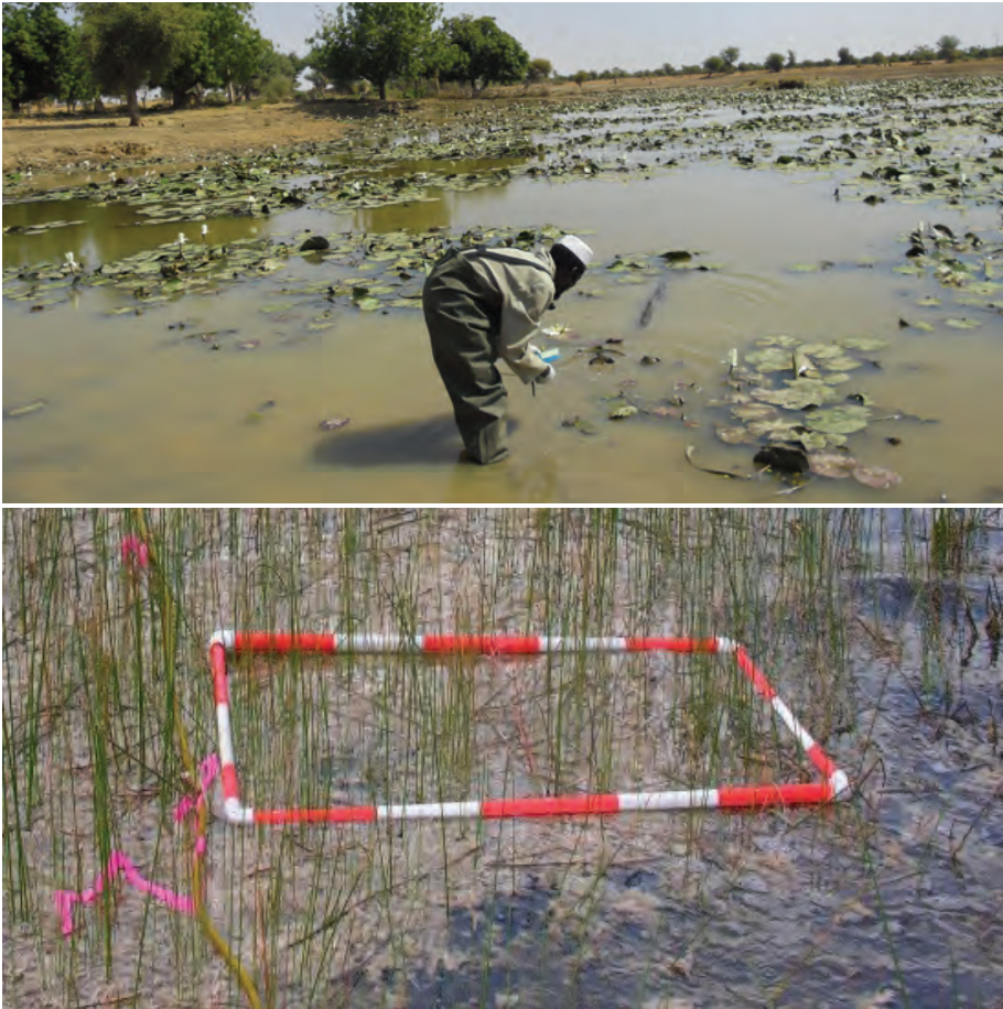
Figure 4.1 Prélèvement de mollusques aquatiques dans une mare (ci-dessus) et prélèvement en quadrats de mollusques amphibiens à l'aide d'un cadre en métal (ci-dessous)

Lorsque les espèces cibles sont amphibies, on délimite des parcelles de marais de 100 m 2 (10 m x 10 m). Chaque parcelle doit être entourée de pieux et de fil de fer pour empêcher les mollusques de s'échapper des parcelles d'essai.