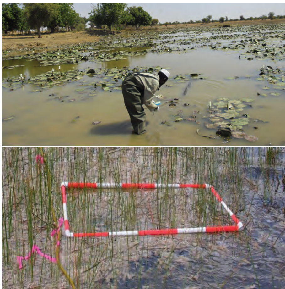
Figure 4.1 Prélèvement de mollusques aquatiques dans une mare (ci-dessus) et prélèvement en quadrats de mollusques amphibiens à l'aide d'un cadre en métal (ci-dessous – photo publiée avec l'aimable autorisation du Dr R. M. Oxborough)

Lorsque les espèces cibles sont amphibiens, on délimite des parcelles de marais de 100 m 2 (10 m x 10 m). Chaque parcelle doit être entourée de pieux et de fil de fer pour empêcher les mollusques de s'échapper des parcelles d'essai.