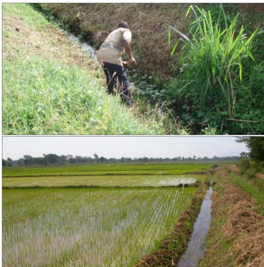
Figure A6.1. Un drain (haut de la figure) et un canal d'irrigation (en bas) à proximité de Moshi (République-Unie de Tanzanie).

Un essai de molluscicide à grande échelle a été mené dans une plantation de cannes à sucre, près de Moshi (République-Unie de Tanzanie) dans l'objectif de lutter contre les mollusques aquatiques Biomphalaria pfeifferi et Bulinus spp. (Crossland 1963). Le site d'essai était constitué de cinq canaux d'irrigation parallèles (Figure A6.1) d'environ 1 m de large et 500 m de long, équipés de dispositifs de contrôle du flux d'eau (Fenwick 1970).