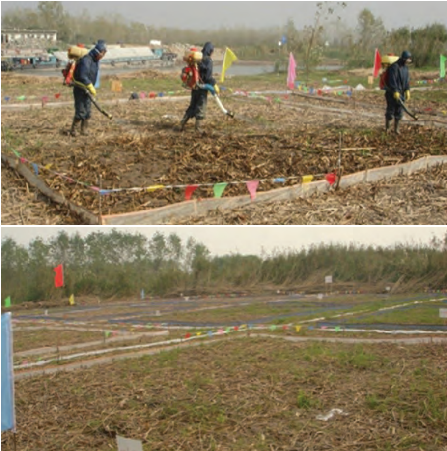
Figure A6.2. Un marais divisé en parcelles de 100 m 2 en vue de tester un molluscicide contre des mollusques amphibiens Oncomelania spp. (Photo publiée avec l'autorisation du Dr G.-J. Yang).