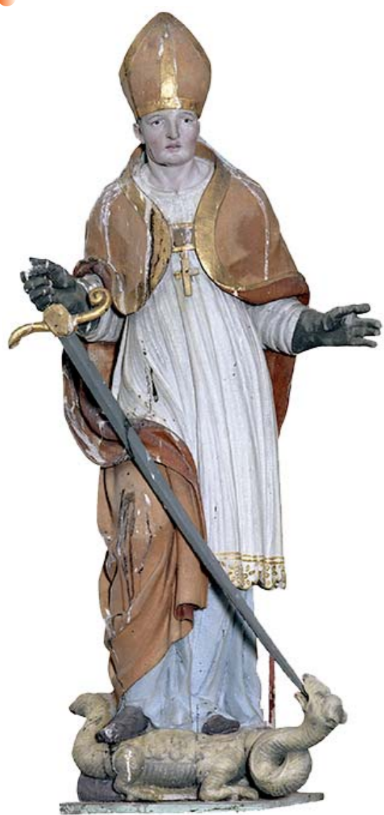
Blaincourt (10), Saint Loup