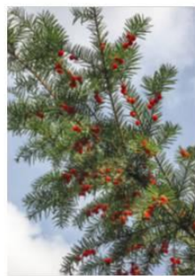
Taxus baccata