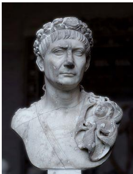
Marcus Ulpius Nerva Traianus (53 ? – 117) Glyptothèque, Munich