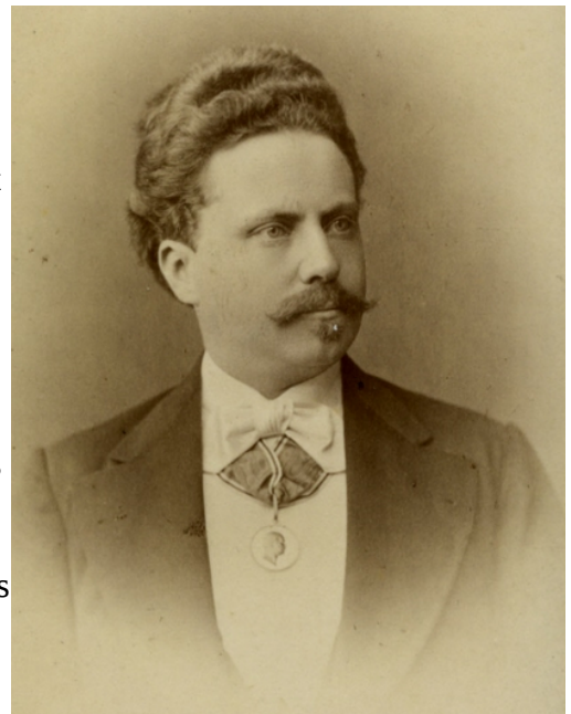
Ladislav Weinek 1

Si les générations futures se souviendront de moi, ce sera sans doute pour mes travaux sélénographiques; mais l'événement qui a marqué toute ma carrière, et que je me remémore toujours avec une profonde nostalgie, c'est le voyage que je fis aux antipodes, voilà près de 37 ans, pour observer le passage de Vénus devant le Soleil. A force de revivre cette expédition par la pensée, pour tenter de retrouver, pour les analyser, toutes les sensations et émotions qui s'attachèrent à chacune de ses étapes, feuilletant à l'occasion mes blocs à dessin de l'époque, j'en ai gardé un souvenir aussi précis que si elle avait eu lieu l'an dernier.