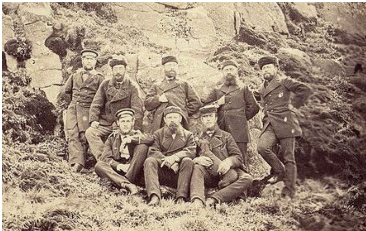
L'équipage de la Gazelle aux îles Kerguelen 5

Pendant les quatre heures et demie du passage, nous exposâmes 21 plaques humides et 40 sèches. Nous en aurions pris le double, si des nuages de plus en plus épais n'avaient pas considérablement atténué la brillance du Soleil dans la deuxième moitié du passage. Malgré cela, nous parvînmes à observer correctement les deux derniers contacts. Nous eûmes aussi la chance d'avoir une atmosphère exceptionnellement calme; le vent fort qui fut de règle tout au long de notre séjour aurait fortement agité les instruments et mis en cause la précision des mesures.