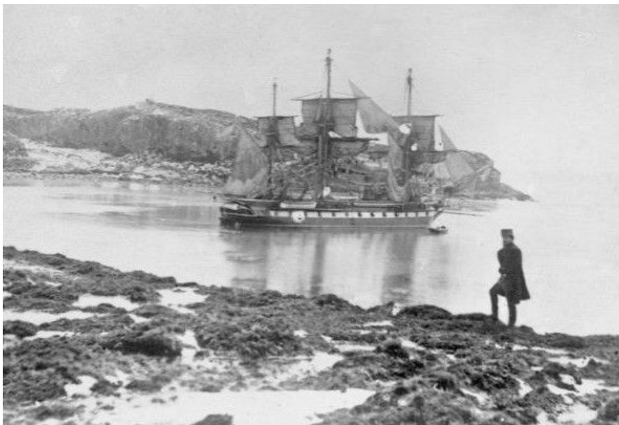
La corvette Gazelle à l'ancre à Betsy Cove 3