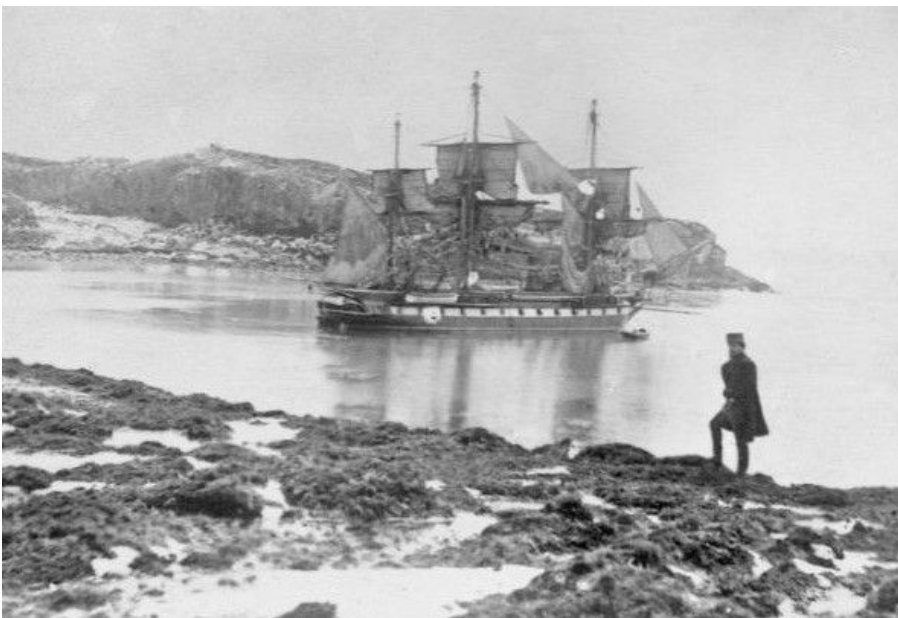
La corvette Gazelle à l'ancre à Betsy Cove 3