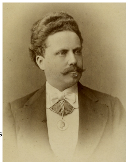
Ladislav Weinek 1

Si les générations futures se souviendront de moi, ce sera sans doute pour mes travaux séléno-graphiques; mais l'événement qui a marqué toute ma carrière, et que je me remémore toujours avec une profonde nostalgie, c'est le voyage que je fis aux antipodes, voilà près de 37 ans, pour observer le passage de Vénus devant le Soleil. A force de revivre cette expédition par la pensée, pour tenter de retrouver, pour les analyser, toutes les sensations et émotions qui s'attachèrent à chacune de ses étapes, feuilletant à l'occasion mes blocs à dessin de l'époque, j'en ai gardé un souvenir aussi précis que si elle avait eu lieu l'an dernier.