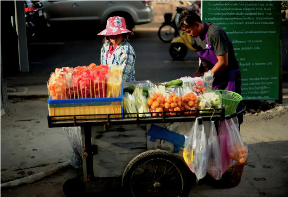
Vendeurs de fruits, Bangkok, 4 décembre 2019.