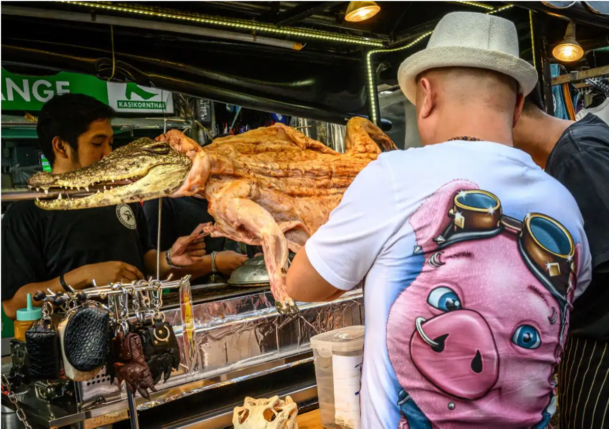
Un client achète du crocodile rôti dans une rue de Bangkok, 3 décembre 2019.