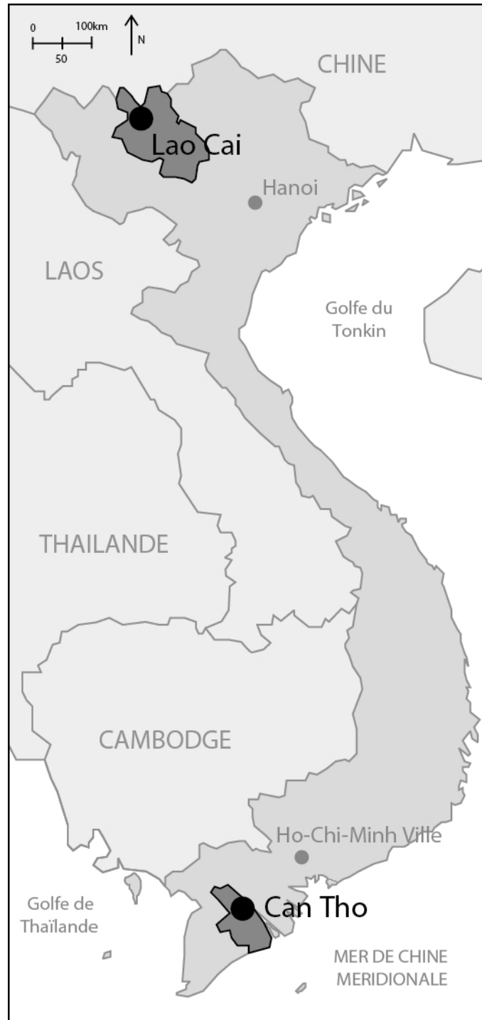
1. Localisation de Lao Cai et Can Tho (Clara Jullien, 2020)

Qu'elles soient situées dans les deltas, dans les zones côtières ou sur les berges de fleuves, de nombreuses villes au Vietnam font face au risque d'inondation. C'est le cas de Lao Cai et de Can Tho.