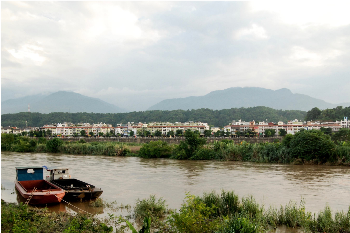
4. Urbanisation récente le long du fleuve Rouge à Lao Cai, sur les berges endiguées et rehaussées (Gwenn Pulliat, 2017)

fleuve, sur des terres en partie agricoles. Des nouveaux quartiers urbains sont en cours de développement le long du fleuve dans le prolongement du centre-ville. À proximité du centre, il s'agit principalement de projets d'immeubles sur les berges, tandis que dans la frange urbaine au sud de la ville, les nouveaux quartiers sont moins denses et accueillent les ménages anciennement agricoles de ces espaces. Mais les projets d'urbanisation future sont plus ambitieux : le quartier de Xuan Tang en est un exemple. Avec l'ouverture de l'autoroute Hanoi – Lao Cai – Kunming en Chine, dont l'un des points d'accès se trouve à proximité du quartier, plusieurs projets d'urbanisation sont prévus. Ils portent principalement sur la construction de logements, dans un nouveau quartier plus dense mais aussi sur les berges rehaussées, d'une zone artisanale, d'infrastructures de transport, ainsi que d'une université et d'autres projets à venir.