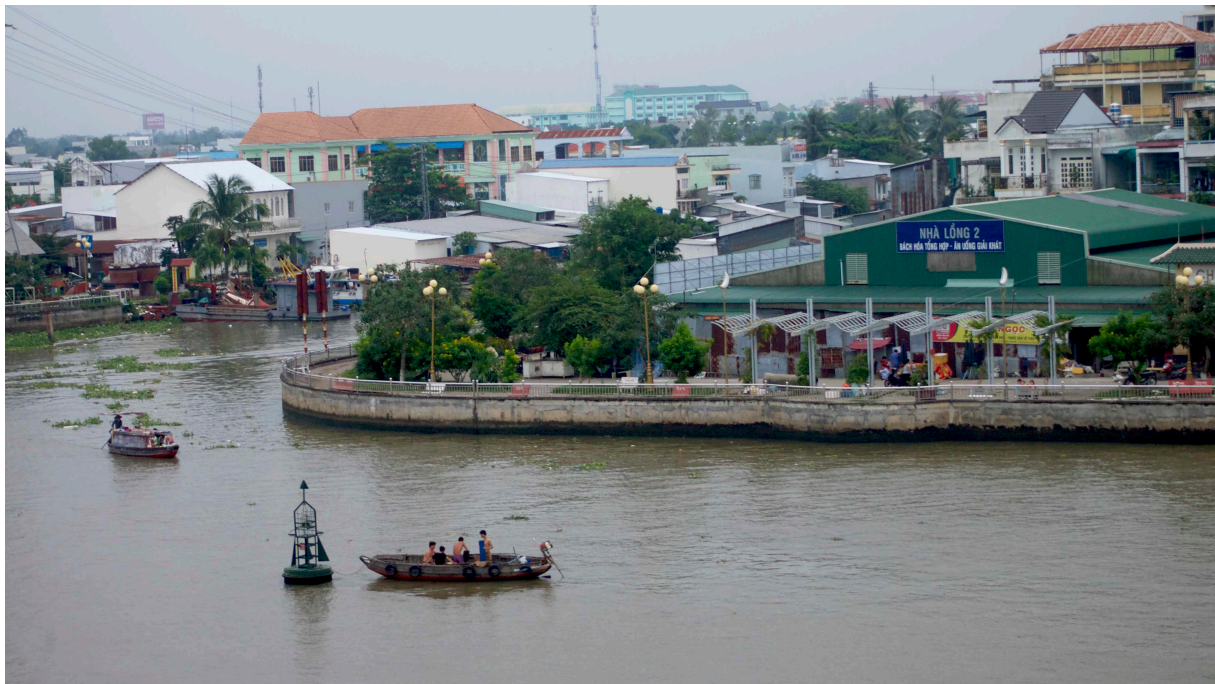
6. Endiguement des berges de la rivière Can Tho dans la périphérie sud-ouest de la municipalité de Can Tho, projet achevé financé par la Banque Mondiale (Clara Jullien, 11 novembre 2019, quartier Le Binh, district de Cai Rang, Municipalité de Can Tho)

Enfin, la mise en avant de la portée environnementale des choix d'aménagement semble répondre aux attentes des bailleurs internationaux. À Can Tho, le réaménagement des berges du fleuve est financé pour partie par plusieurs de ces bailleurs, en particulier la Banque Mondiale et l'Agence Française de Développement. À l'heure de la mise à l'agenda politique mondial des questions d'adaptation au changement climatique, la mise en avant de l'impératif de sécurisation des territoires devient primordiale pour obtenir les financements internationaux escomptés. Le couplage des impératifs environnementaux et des projets d'aménagement urbain peut ainsi permettre de rendre ces derniers prioritaires. À Can Tho comme à Lao Cai les projets d'endiguement et les déplacements de populations associés sont justifiés par l'adaptation au changement climatique, mais permettent aussi une requalification urbaine des berges.