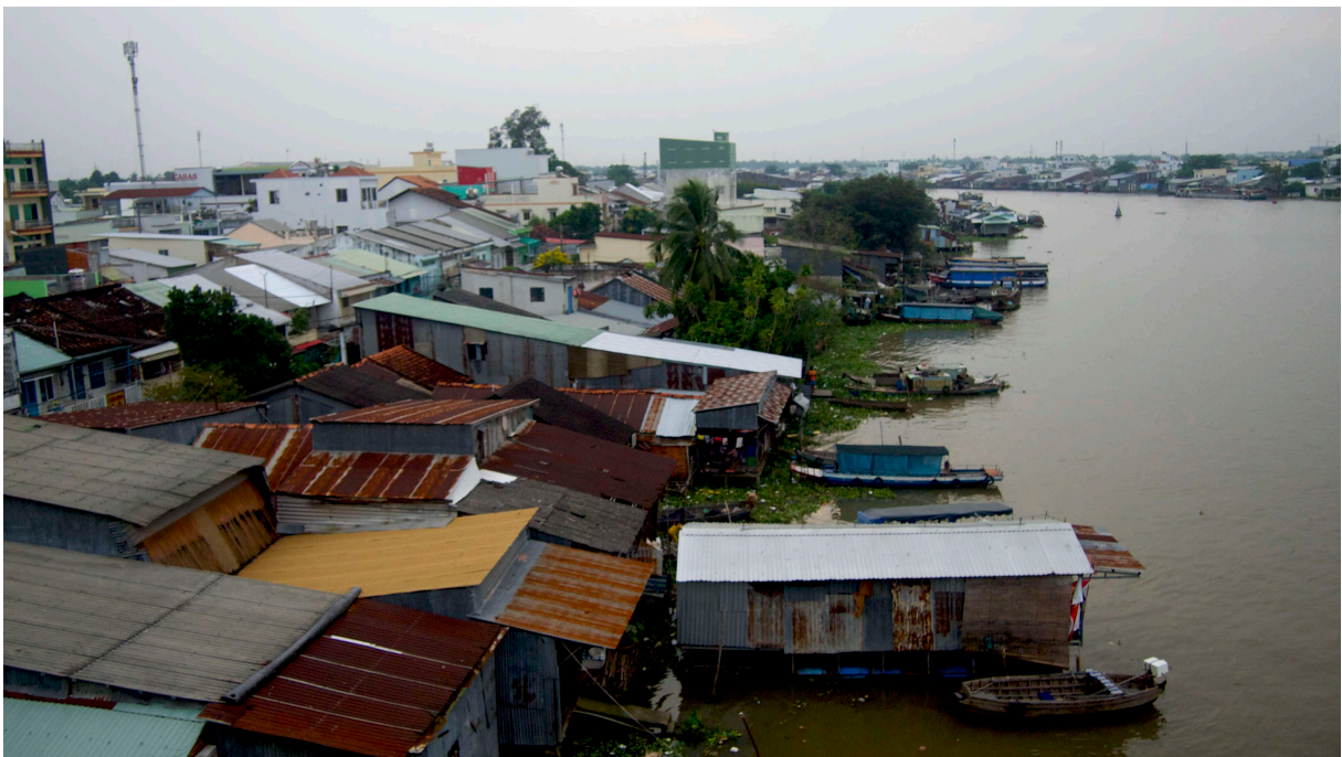
Couverture : Habitations et marché de Le Binh à Can Tho (Clara Jullien, quartier Le Binh, district de Cai Rang, Municipalité de Can Tho, 11 novembre 2019)

Pour citer cet article : Jullien C. et Pulliat G., 2020, « La gestion des risques dans les villes vietnamiennes : une lecture critique des politiques environnementales », Urbanités , Dossier / Urbanités sud-est asiatiques, septembre 2020, en ligne .