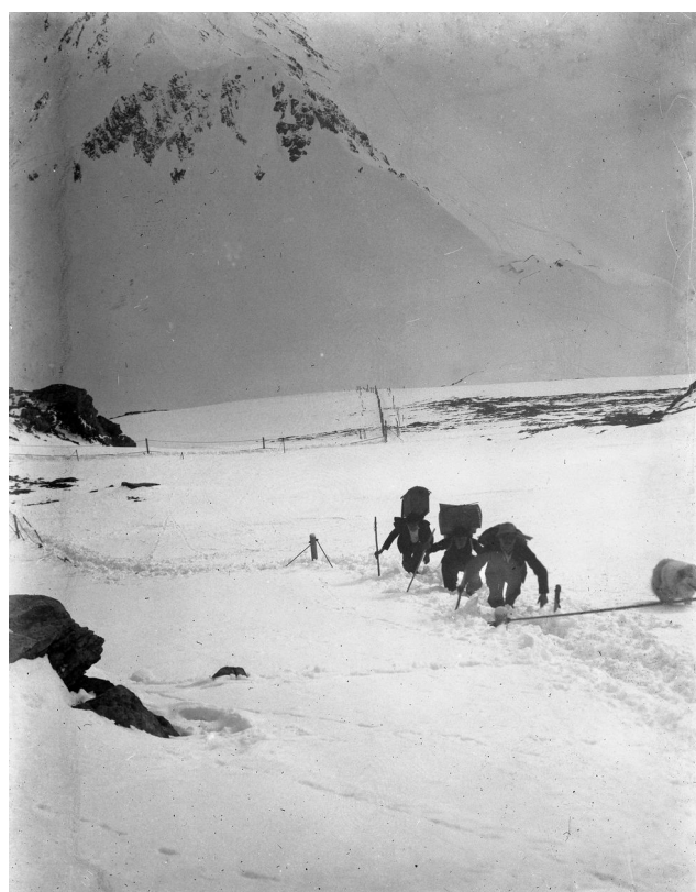
Les porteurs sur le point d'atteindre l'Observatoire