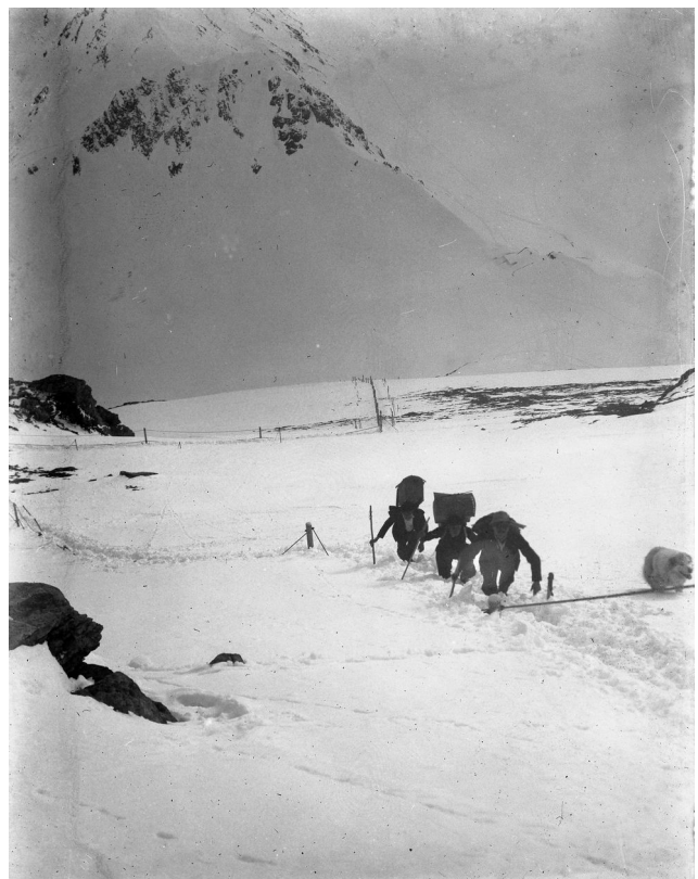
Les porteurs sur le point d'atteindre l'Observatoire